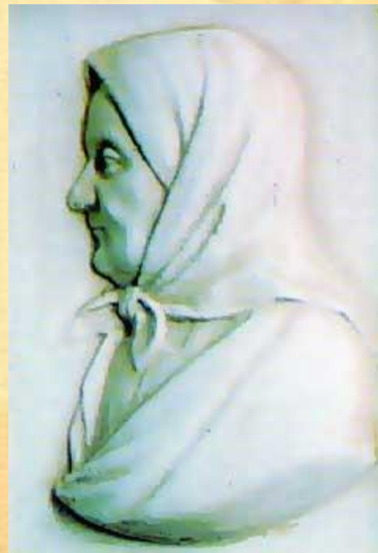
Яковлева Арина Родионовна

Любовь к родному языку маленькому Пушкину привили бабушка, Мария Алексеевна Ганнибал, превосходно говорившая и писавшая по-русски, и няня Арина Родионовна.