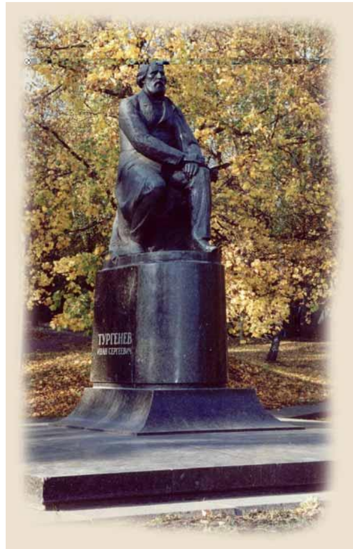
Памятник Тургеневу И.С.