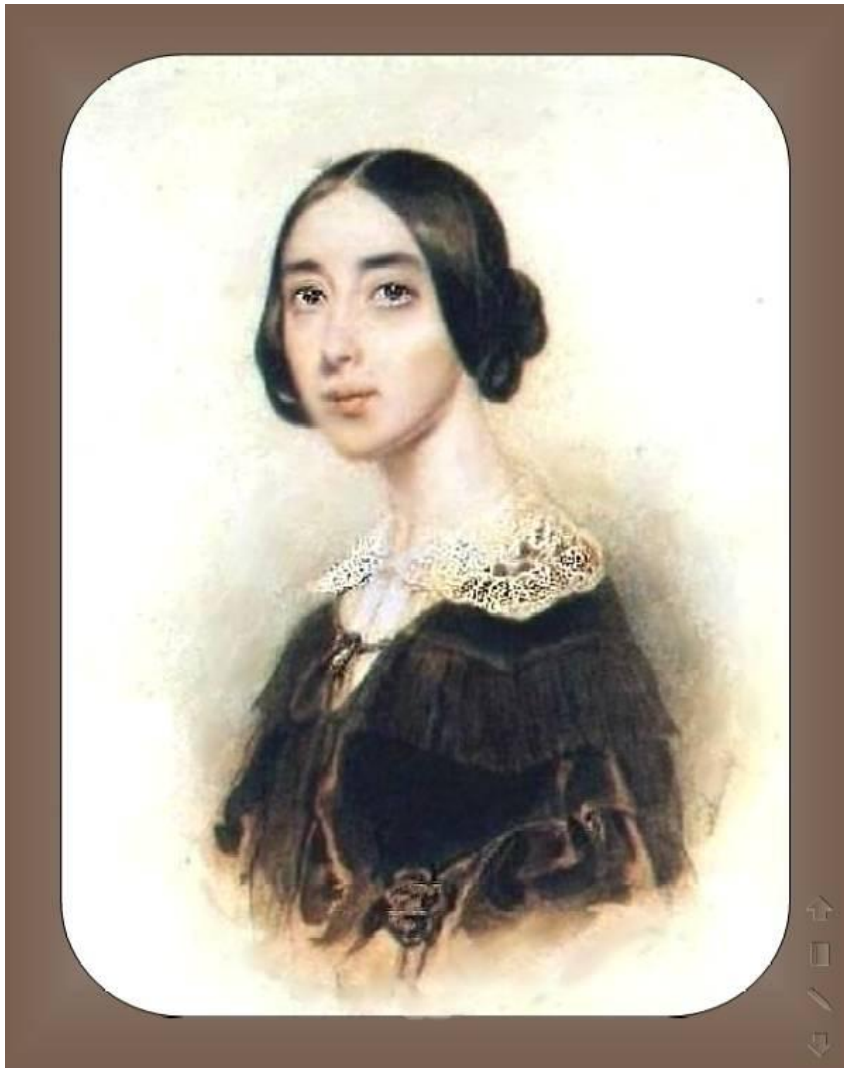
Полина Виардо (Виардо-Гарсия)