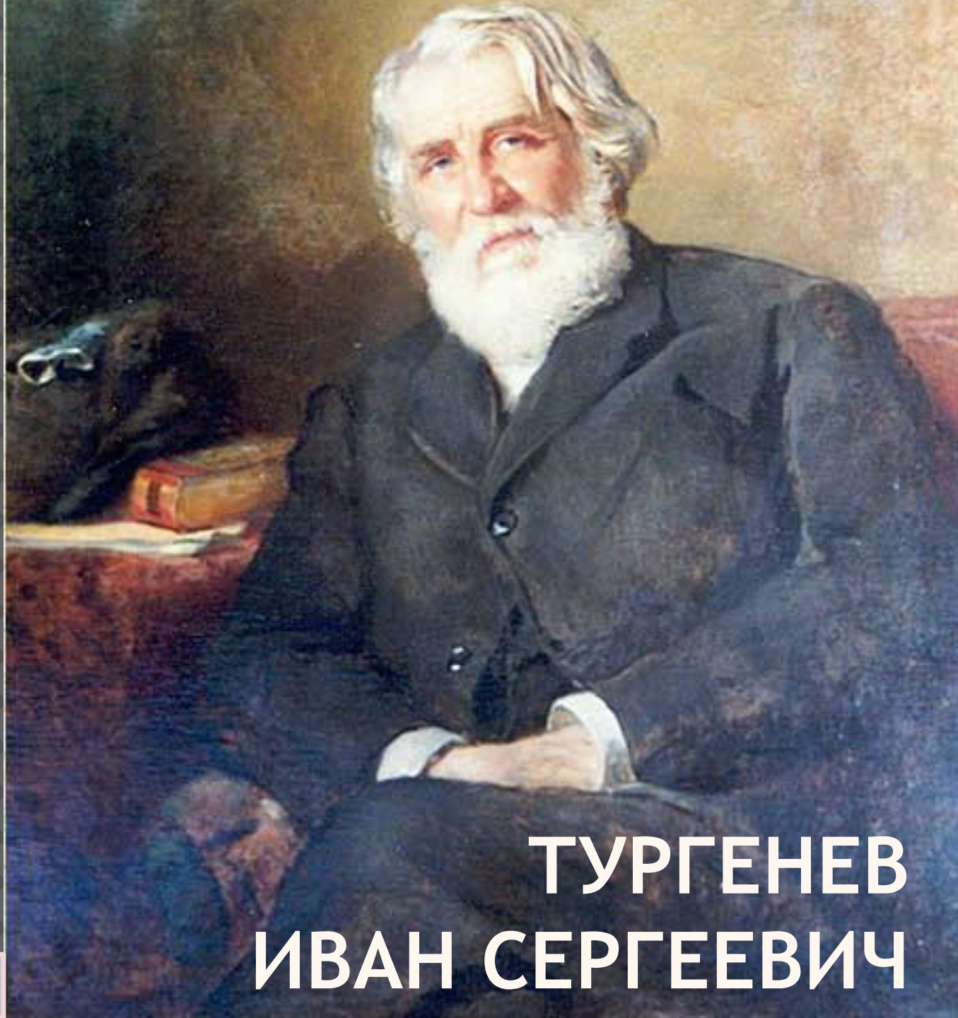
ТУРГЕНЕВ ИВАН СЕРГЕЕВИЧ