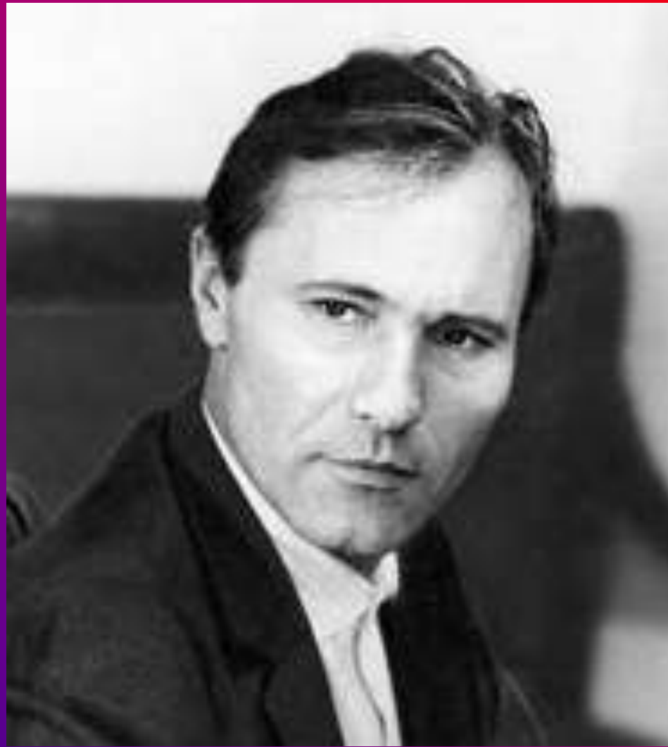
Василий Макарович Шукшин (1927 - 1974)