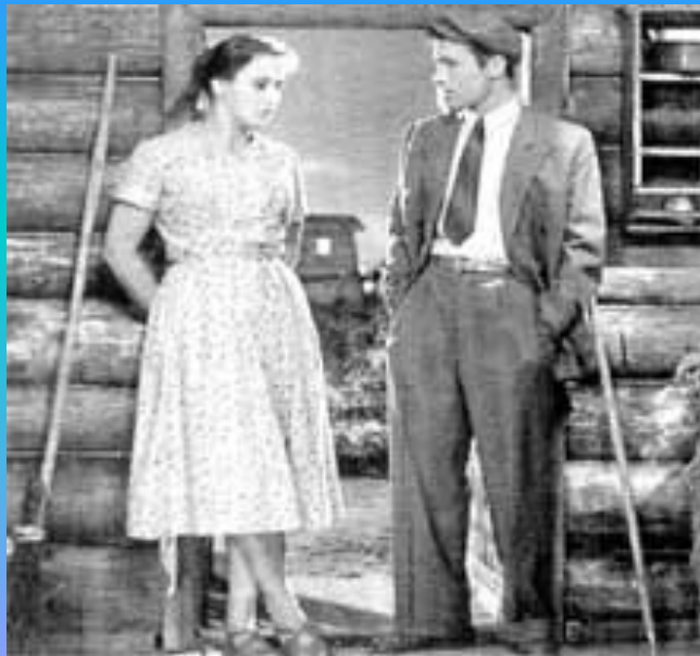
«Живет такой парень»