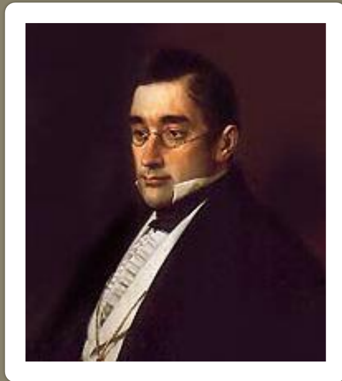
А. С. Грибоедов