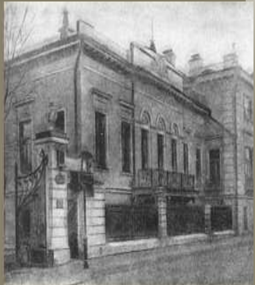
Дом Н. С. Бегичева в Москве