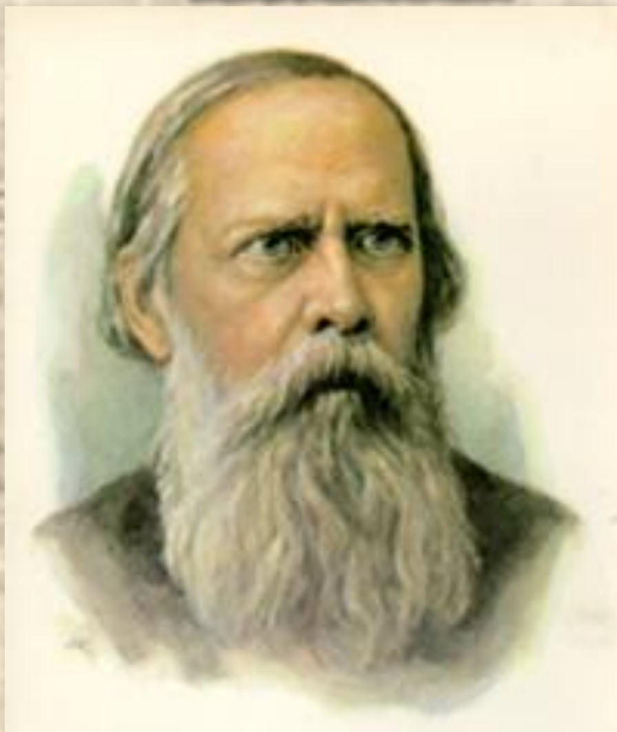
Салтыков-Щедрин (псевдоним - Н. Щедрин) Михаил Евграфович (1826 - 1889), прозаик.