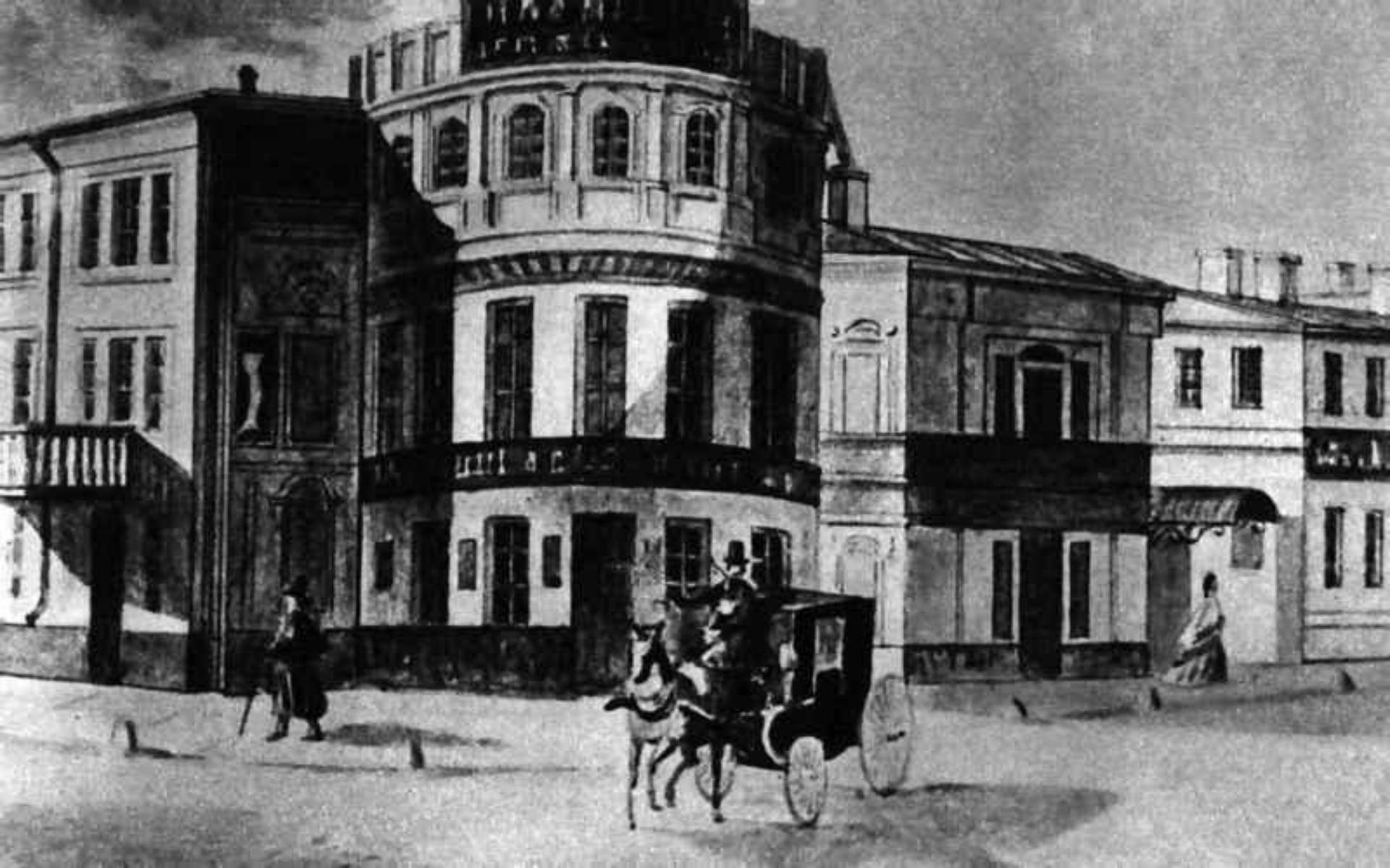
Московский дворянский институт