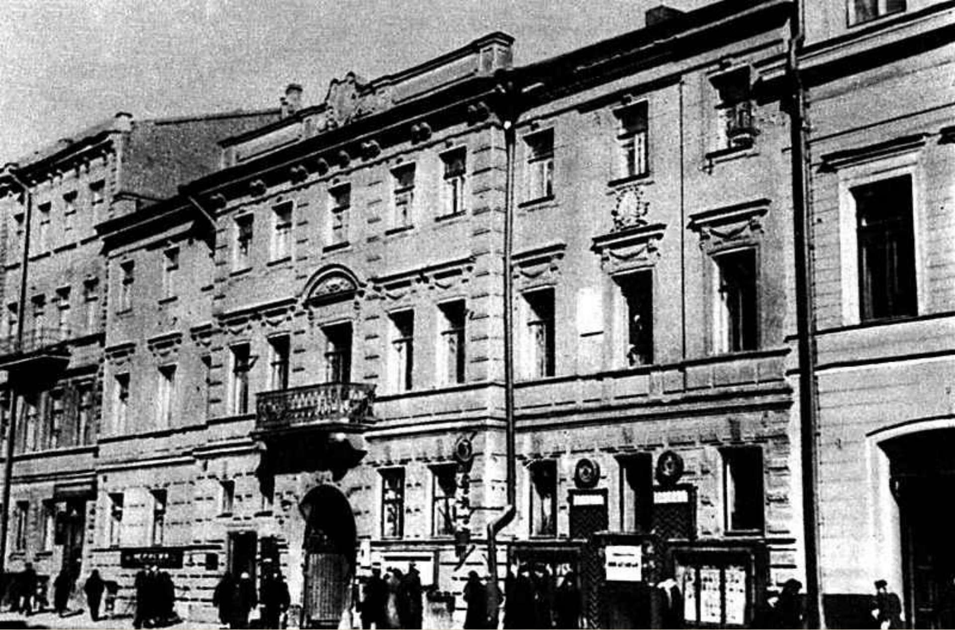
Дом в Петербурге, где жил М.Е.Салтыков