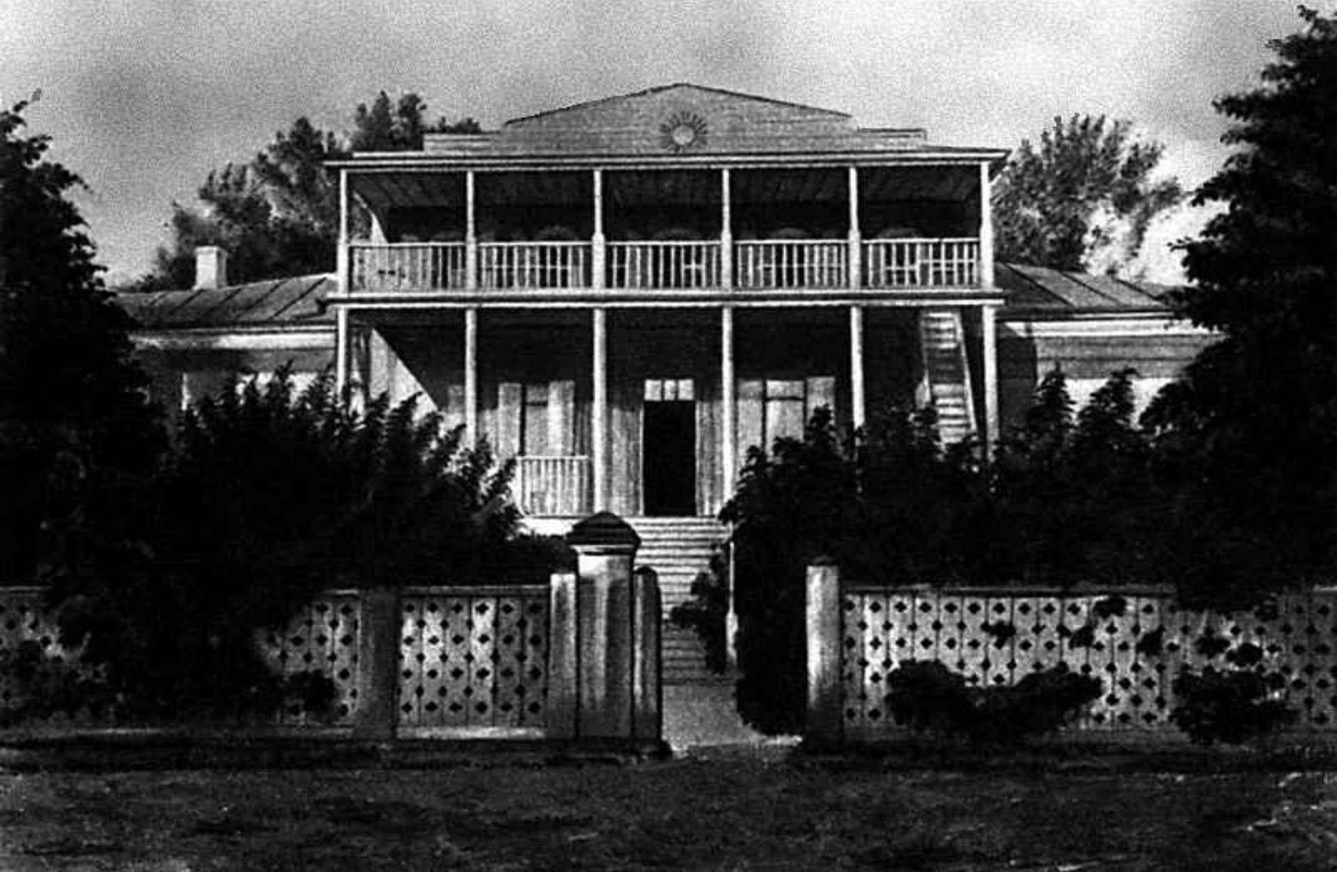
Дом, где родился М.Е.Салтыков