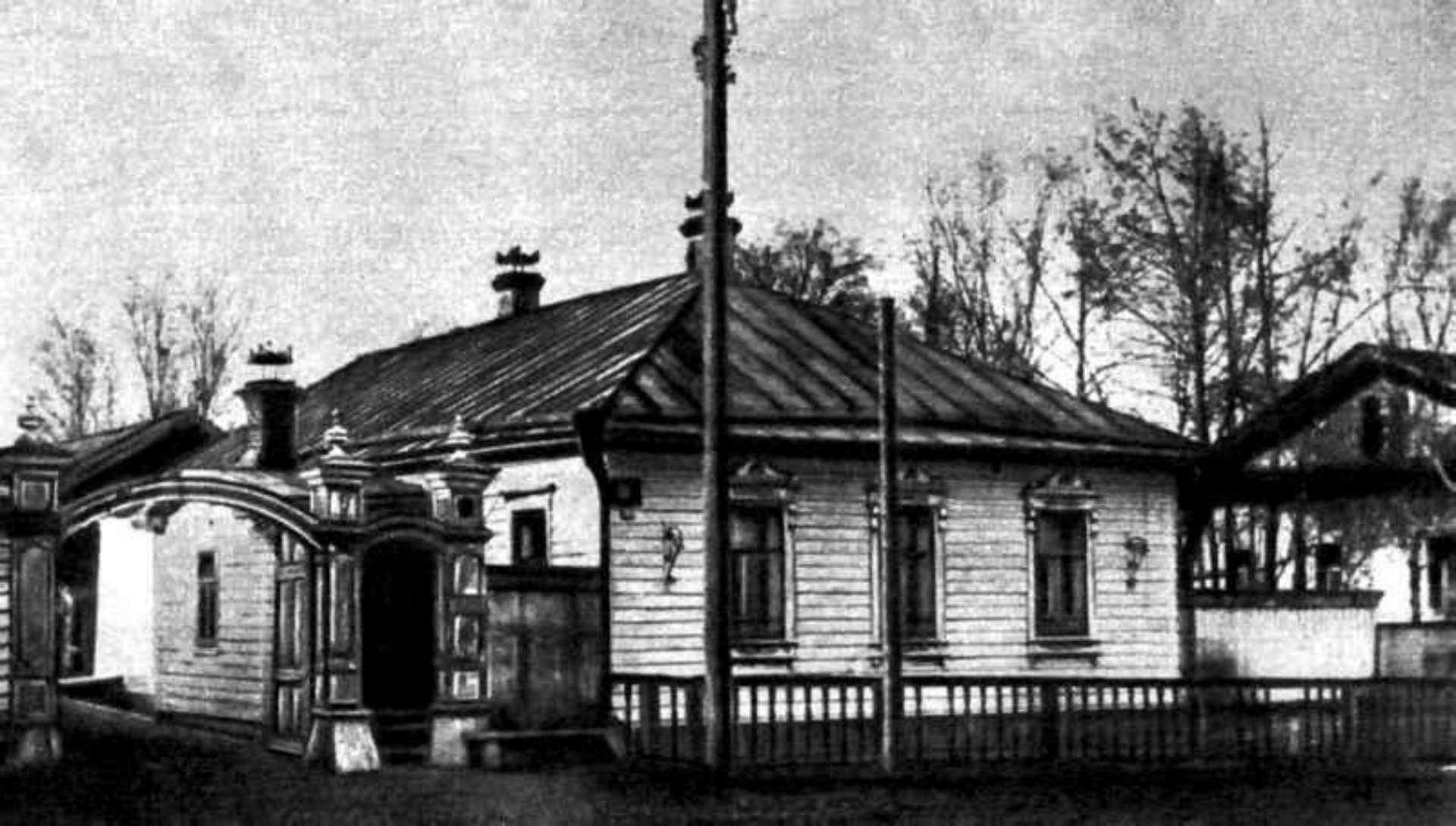
Дом в Вятке, где жил М.Е.Салтыков