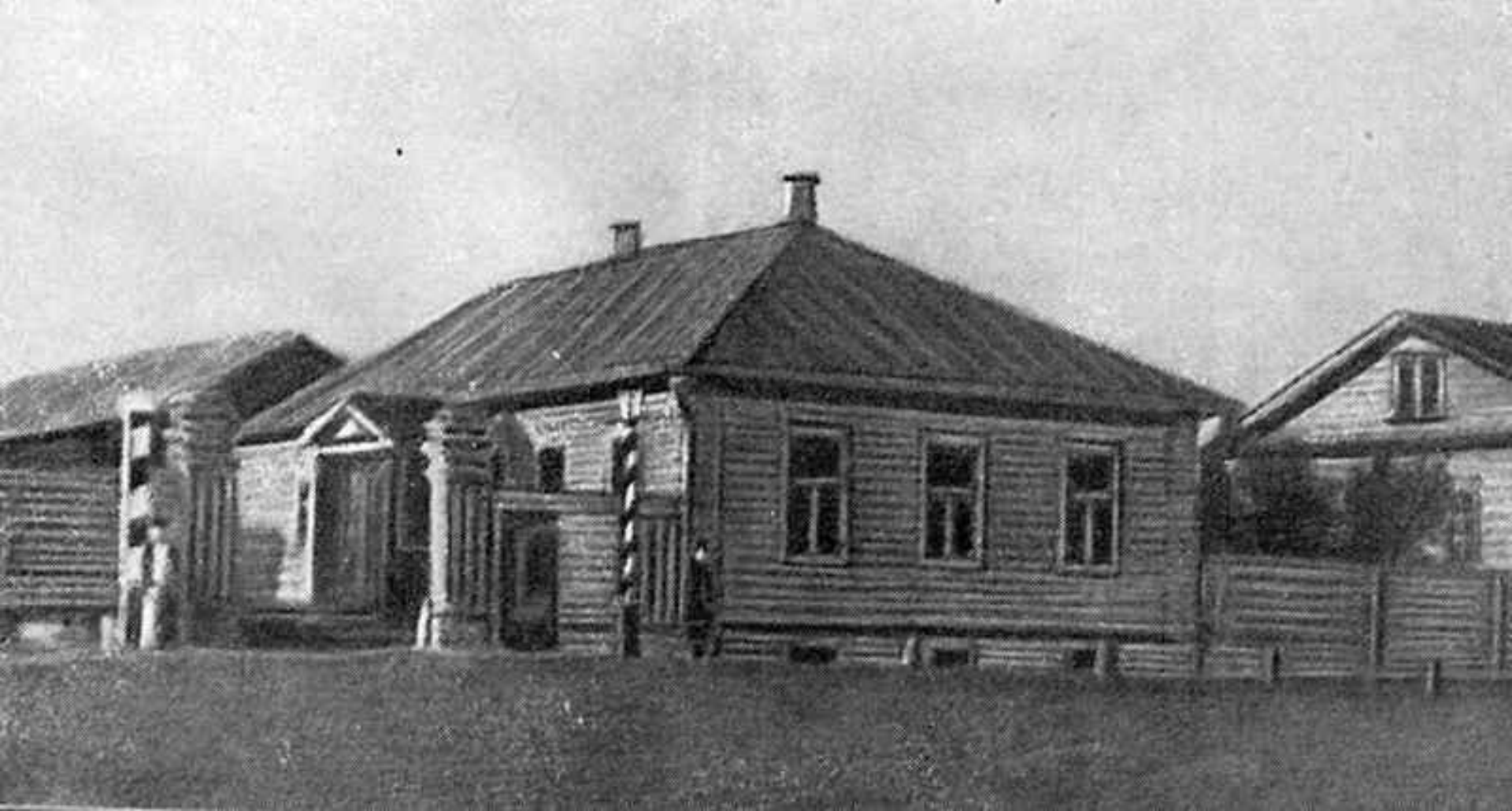
Дом в Вятке, где жил М.Е.Салтыков