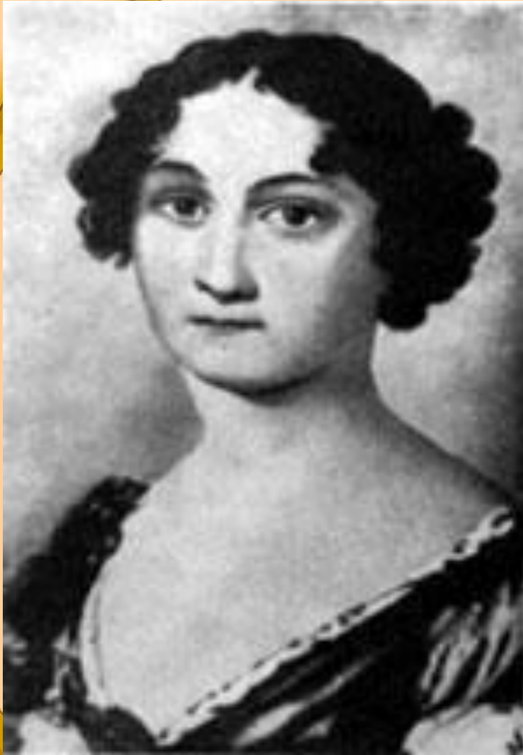
Варвара Петровна Тургенева