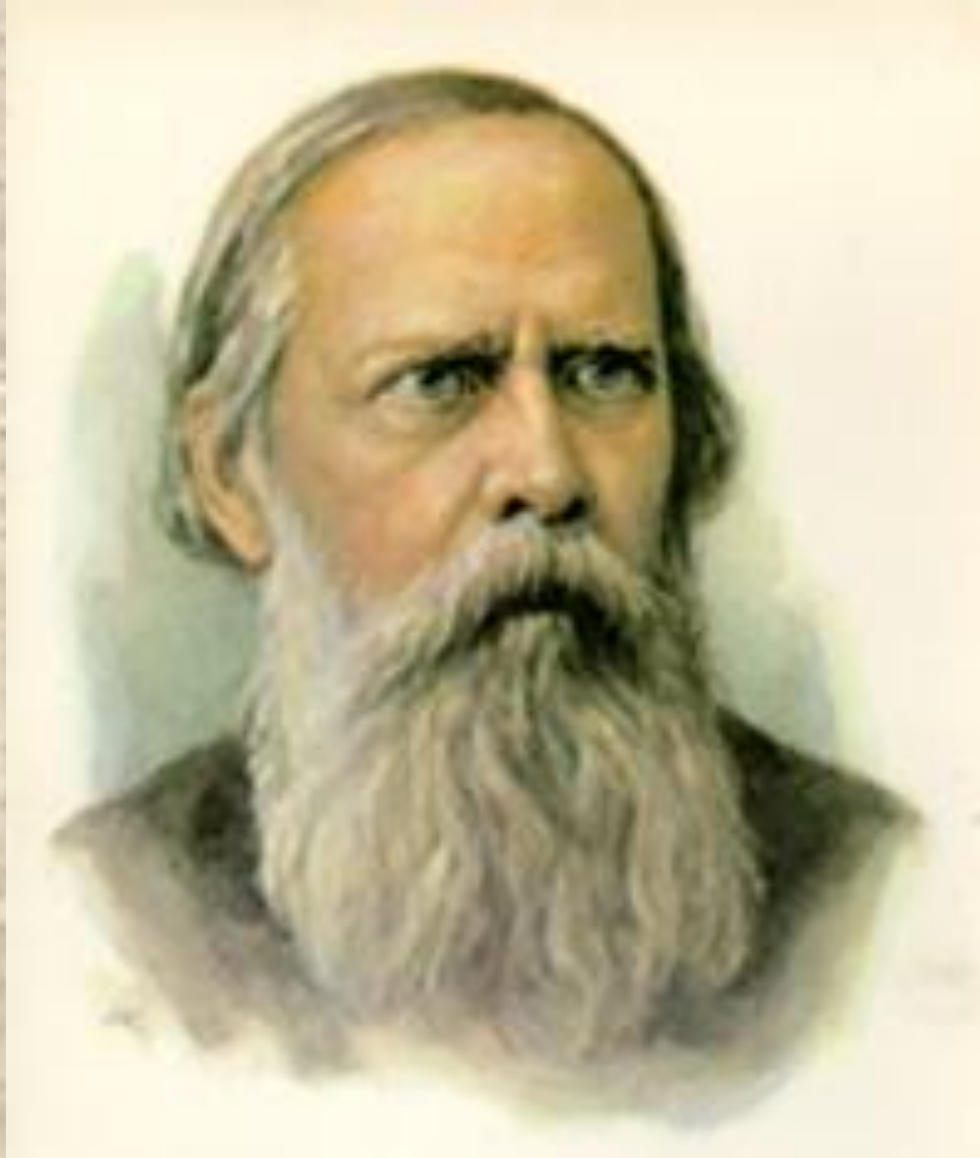
Салтыков-Щедрин (псевдоним - Н. Щедрин) Михаил Евграфович (1826 - 1889), прозаик.