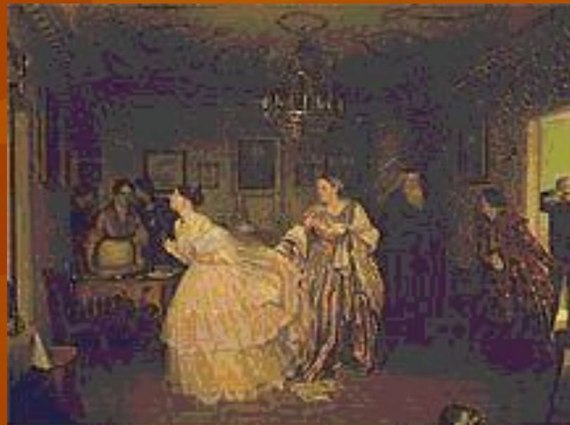
П. А. Федотов. «Сватовство майора». 1848 год. Третьяковская галерея.