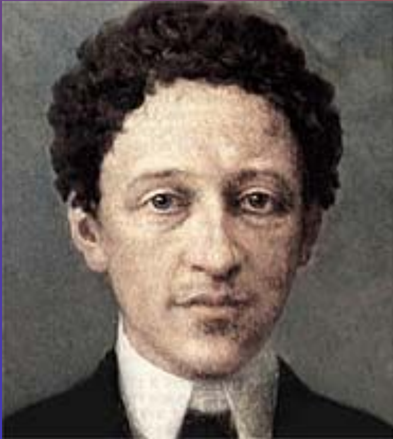
Александр Блок. Портрет работы И. К. Пархоменко. 1910 год.