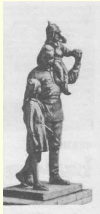
Скульптурная группа «Гайдар с детьми»