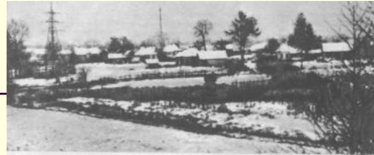
Село Леплява Каневского района под Киевом, возле которого погиб А.Гайдар.

■ А.Гайдар, защищавший Родину, погиб, чтобы ценой своей жизни спасти товарищей.