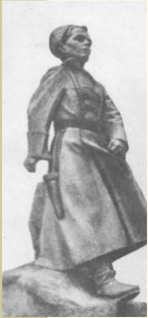
В городе Арзамасе.