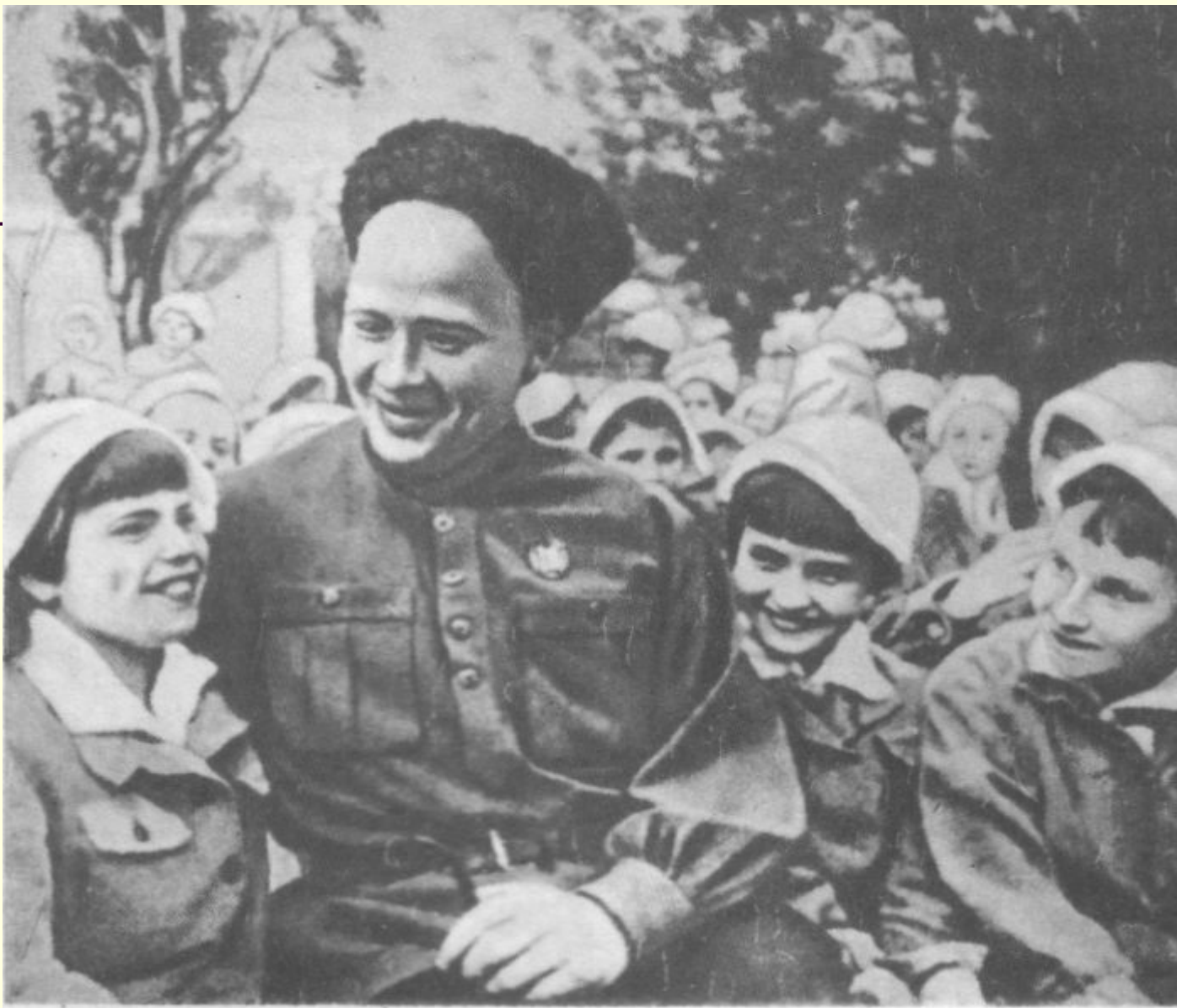
Аркадий Гайдар с пионерами. 1939 г.