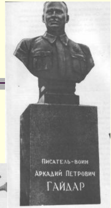
В городе Каневе на могиле писателя.