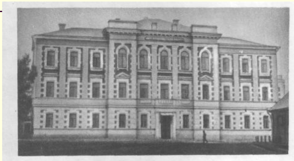
Город Арзамас. Реальное училище, в котором с 1914 по 1918 год учился А. Голиков (Гайдар).