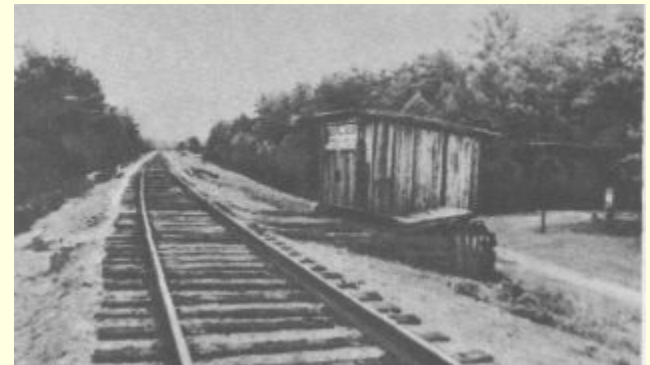
Место гибели А.Гайдара.