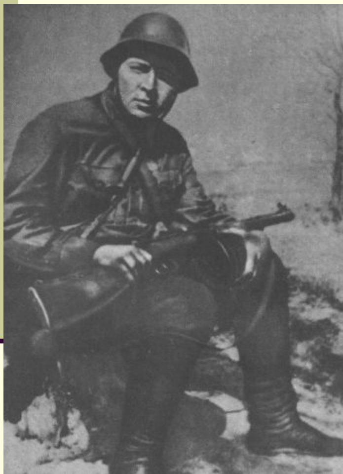
А.Гайдар на фронте. 1941 г.