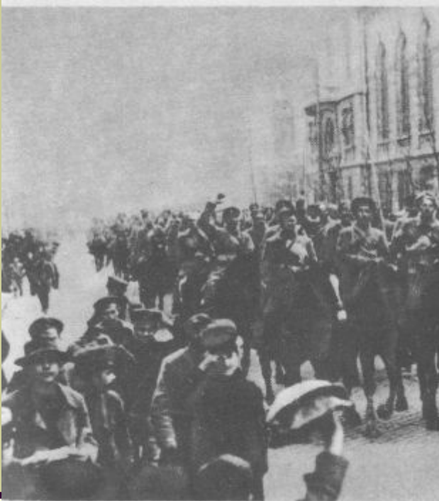
На улицах города.