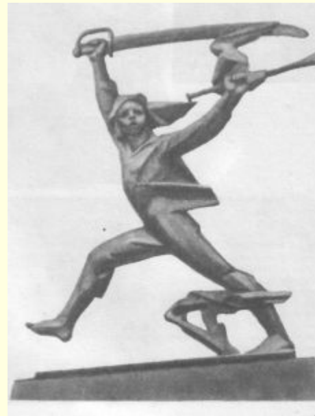
Скульптура Мальчиша-Кибальчиша в Москве на Ленинских горах.