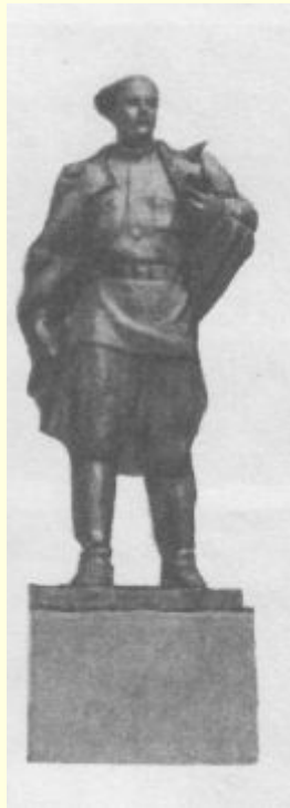
В городе Льгове.