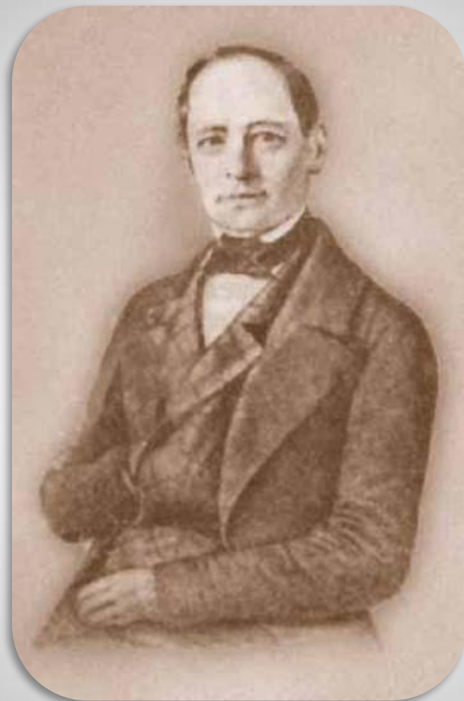
Леонтий Филиппович Магницкий