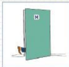
частое обильное мочиспускание