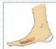
плохое заживление ран