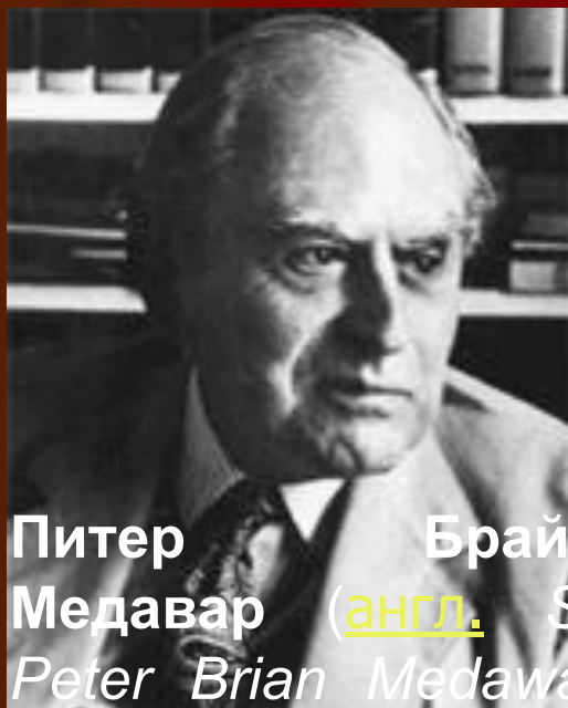
Питер Брайан Медавар ( англ. Sir Peter Brian Medawar ) (р. 28 февраля ) (р. 28 февраля 1915 ) (р. 28 февраля 1915, Рио- де-Жанейро ) (р. 28 февраля 1915, Рио- де-Жанейро — у. 2 октября ) (р. 28 февраля 1915, Рио- де-Жанейро — у. 2 октября 1987 ) — английский биолог.

Особого внимания заслуживают взгляды Бернета на иммунитет как на такую реакцию организма, которая отличает все "свое" от всего "чужого". После доказательств Питером Медаваром иммунной природы отторжения чужеродного трансплантата и накопления фактов по иммунологии злокачественных новообразований стало очевидным, что иммунная реакция развивается не только на микробные антигены, но и тогда, когда имеются любые, пусть незначительные антигенные различия между организмом и тем биологическим материалом (трансплантатом, злокачественной опухолью), с которым встречается организм. Строго говоря, ученые прошлого, включая Мечникова, понимали, что предназначение иммунитета - не только борьба с инфекционными агентами. Однако интересы иммунологов первой половины нашего столетия концентрировались в основном на разработке проблем инфекционной патологии. Необходимо было время, чтобы естественный ход научного познания позволил выдвинуть концепцию роли иммунитета в индивидуальном развитии. И автором нового обобщения был Бернет.