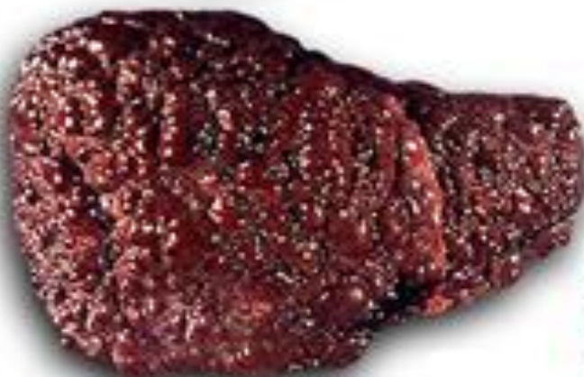
Печень пораженная циррозом