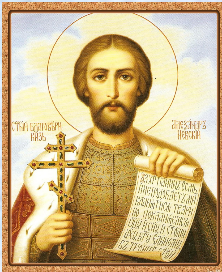
СВЯТОЙ БЛАГОВЕРНЫЙ КНЯЗЬ АЛЕКСАНДР НЕВСКИЙ