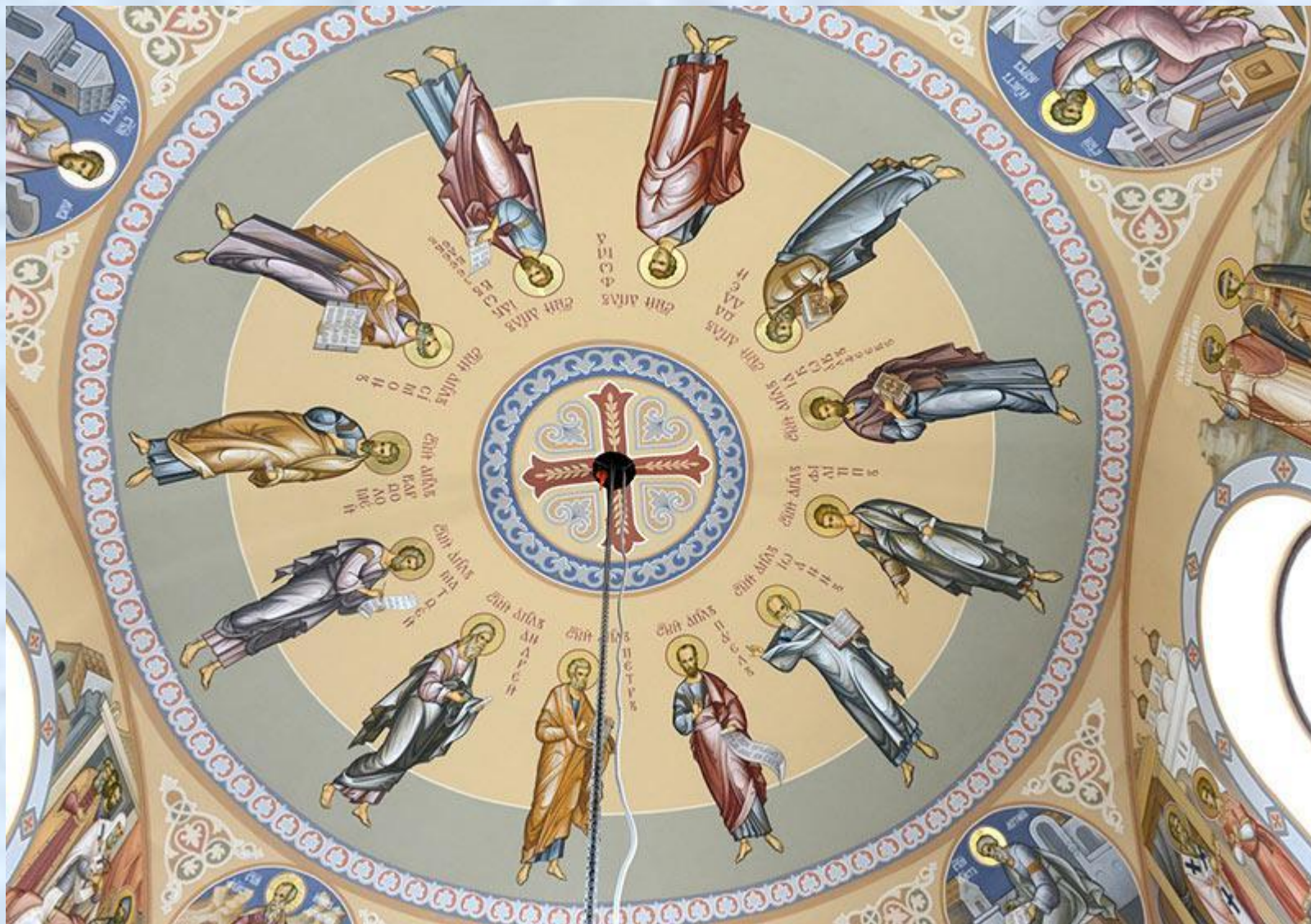
Роспись храма св. Александра Невского города Салехарда