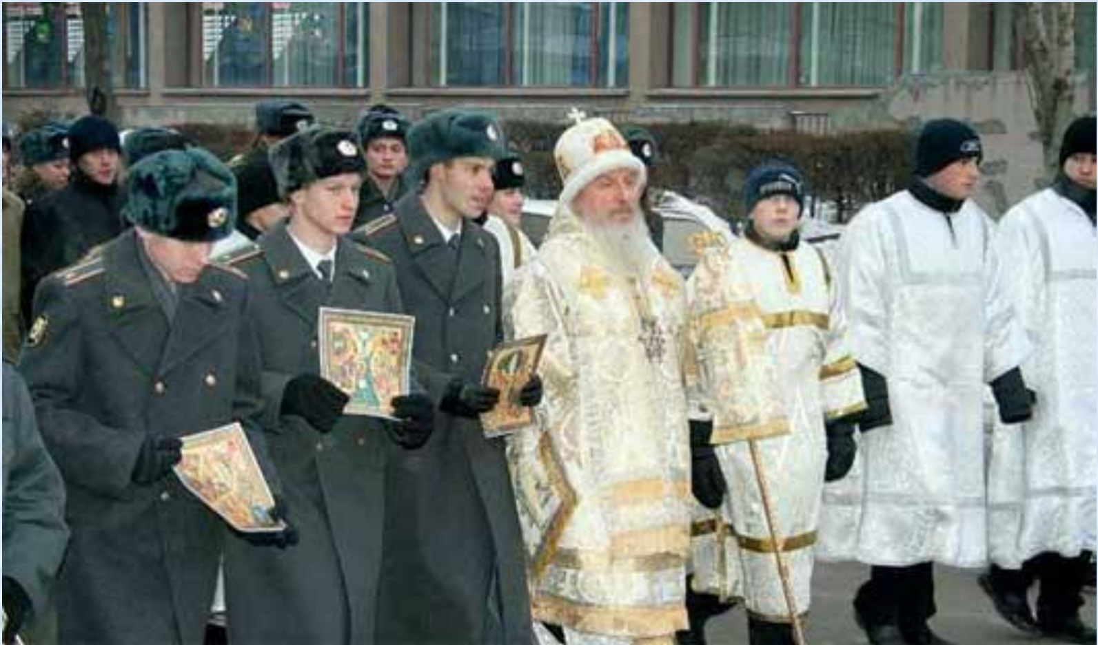
Архиепископ Тобольский и Тюменский Димитрий с курсантами института во время Крещенского крестного хода