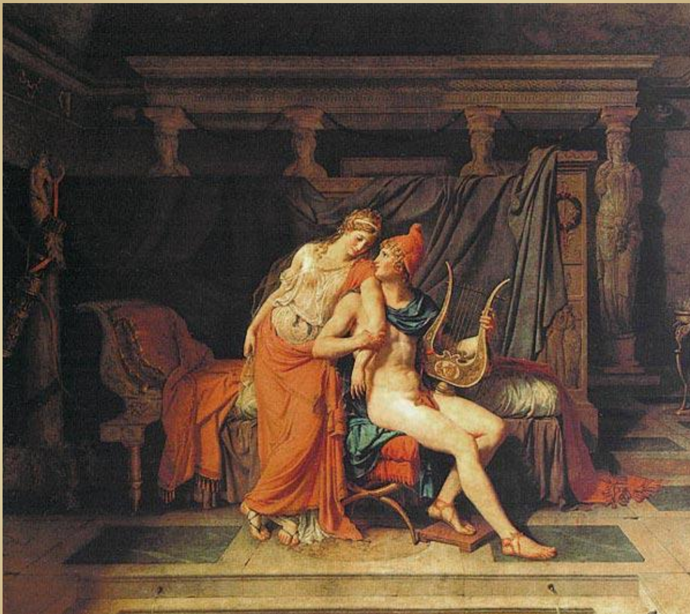
Парис и Елена" 1788, Лувр, Париж