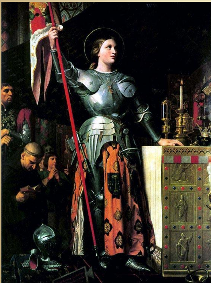
"Жанна д'Арк на коронации Карла VII" 1854