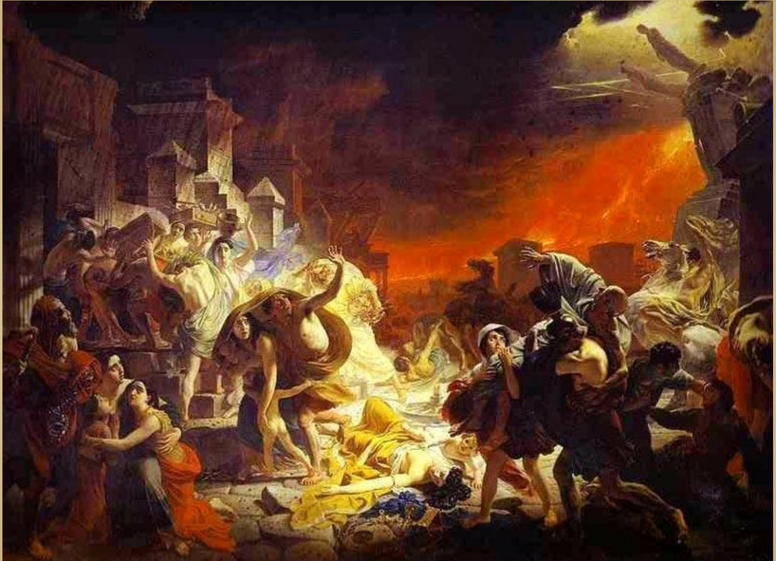
"Последний день Помпеи"