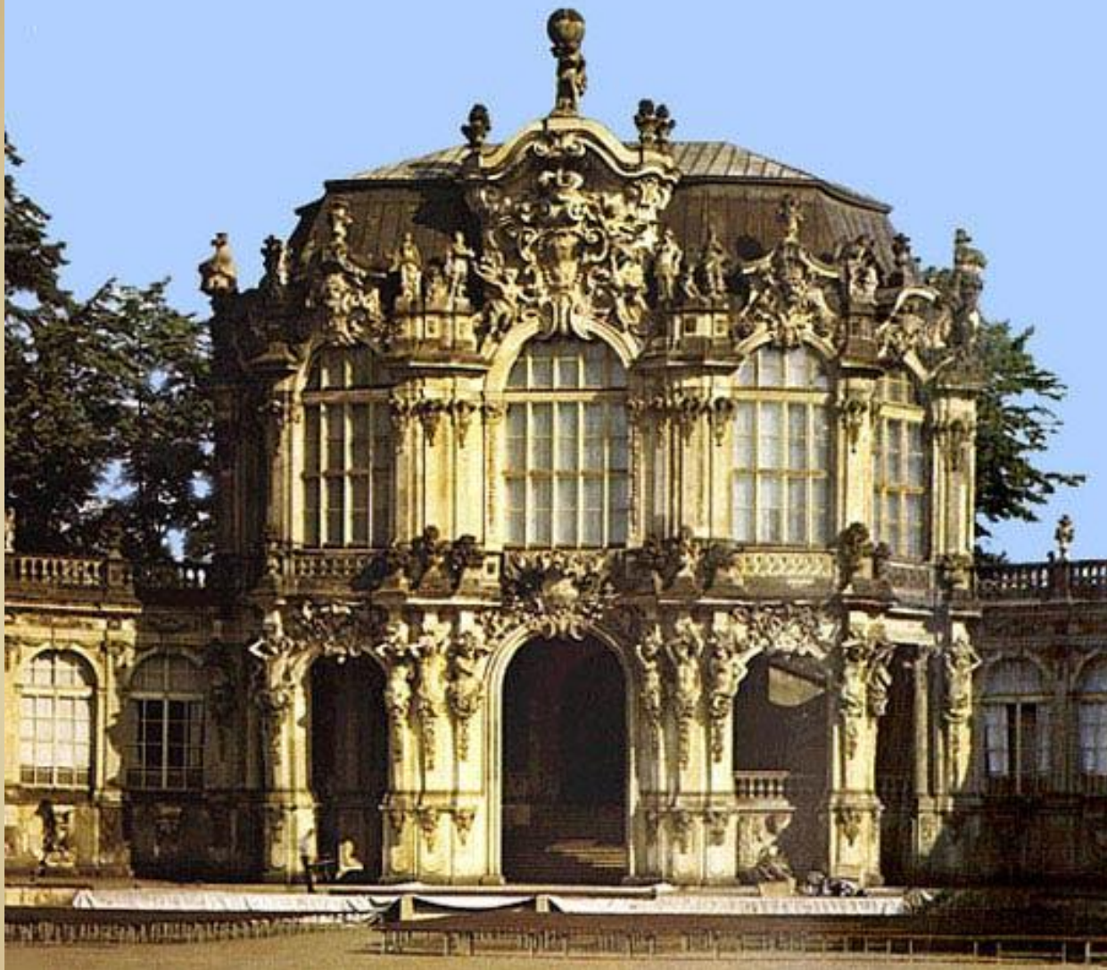
Цвингер Пеппельманн, Пермозер, нач. XVIIIв. Германия Дрезден