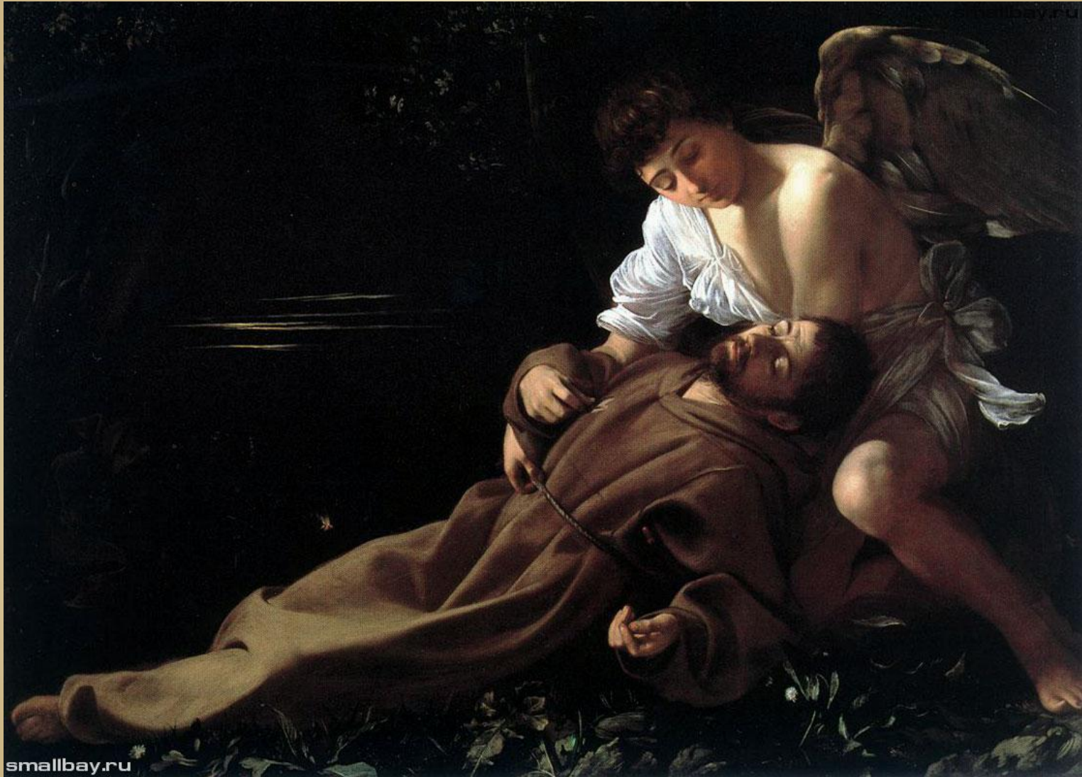
Блаженство святого Франциска 1595, Уодсуорт Атэнеум, Хартфорд