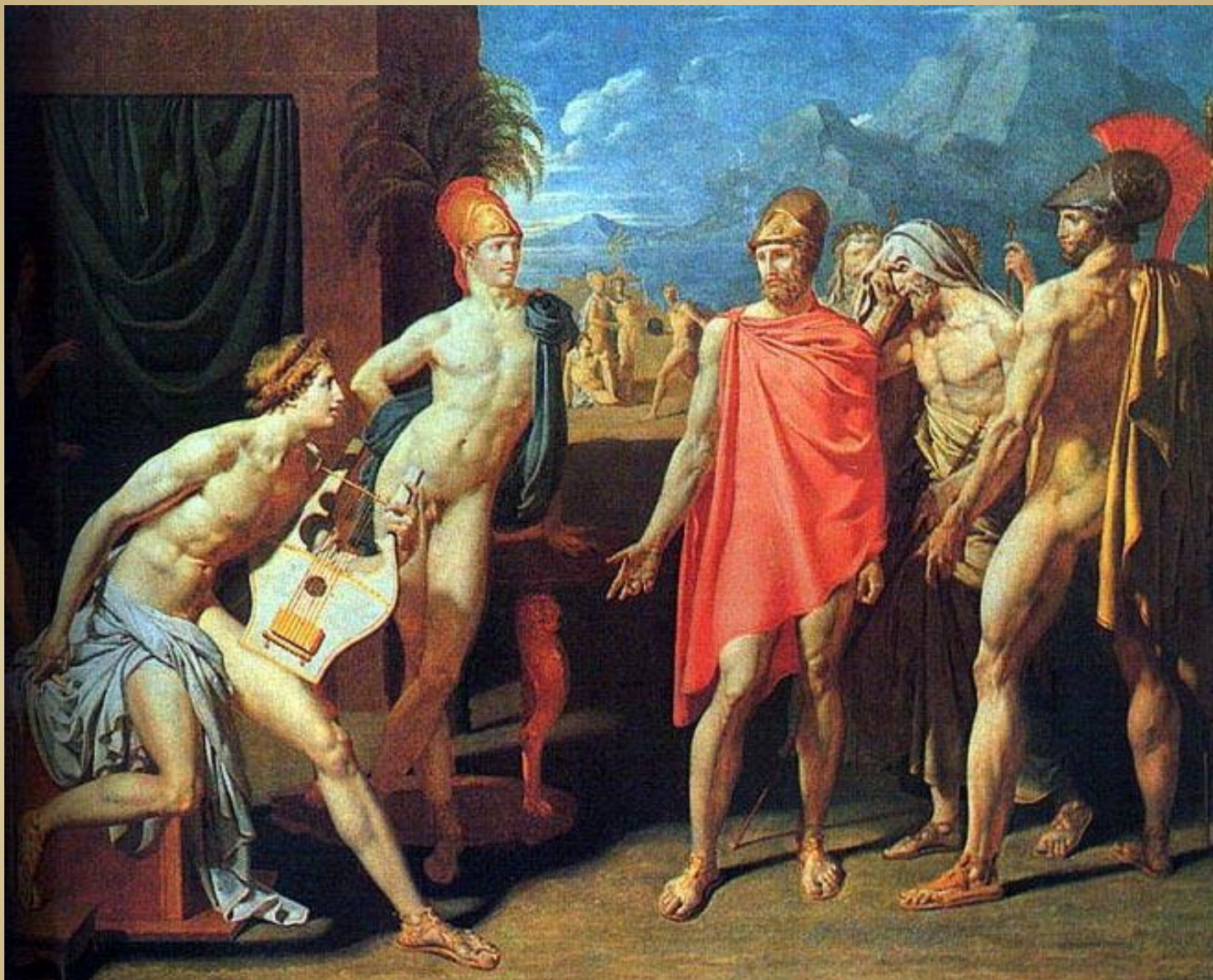
"Послы Агамемнона в палатке Ахиллеса" 1801, Лувр, Париж