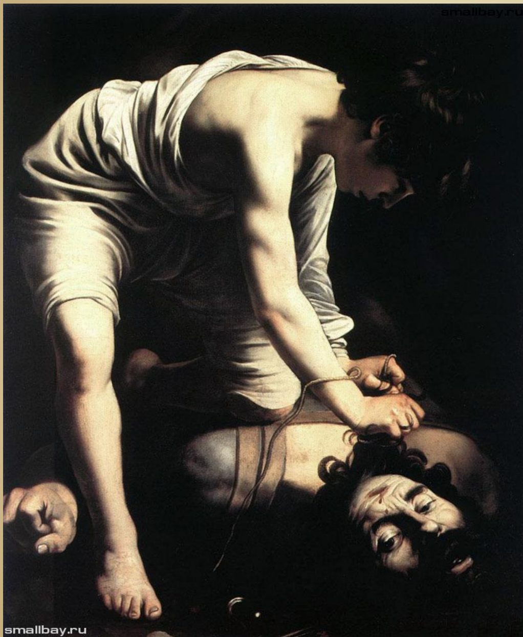
Давид и Голиаф 1601