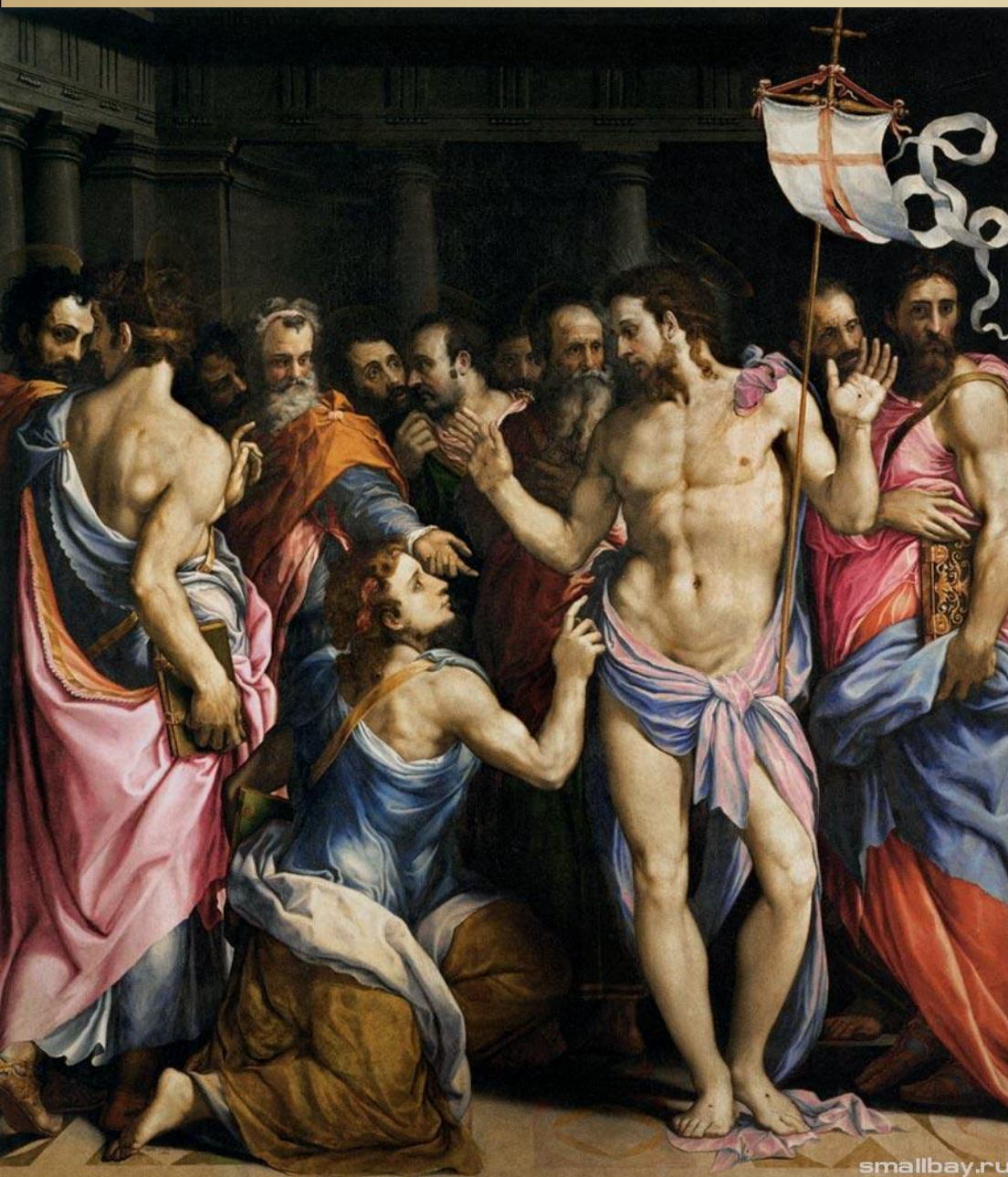
Неверие святого Фомы Сальвиати Франческо Флорентийский живописец