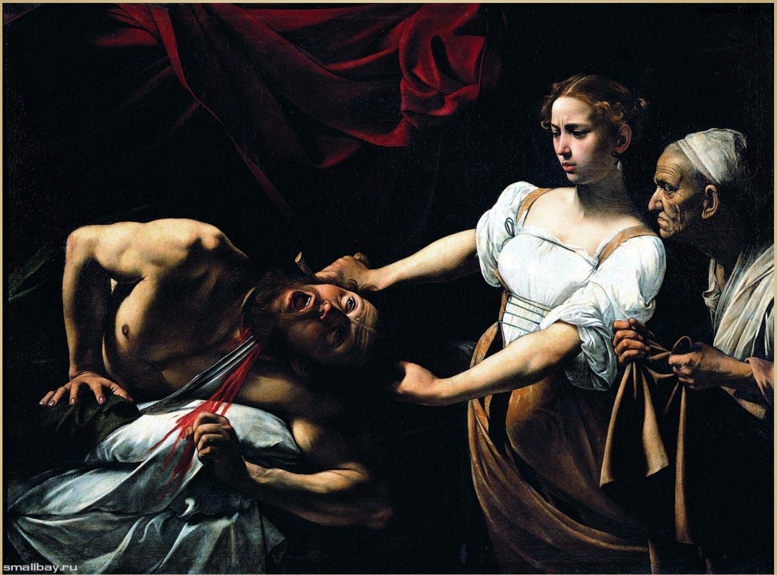
Юдифь, убивающая Олоферна, 1598