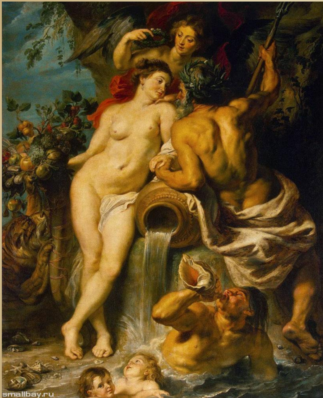
Союз Земли и Воды , 1618 Эрмитаж, Санкт- Петербург