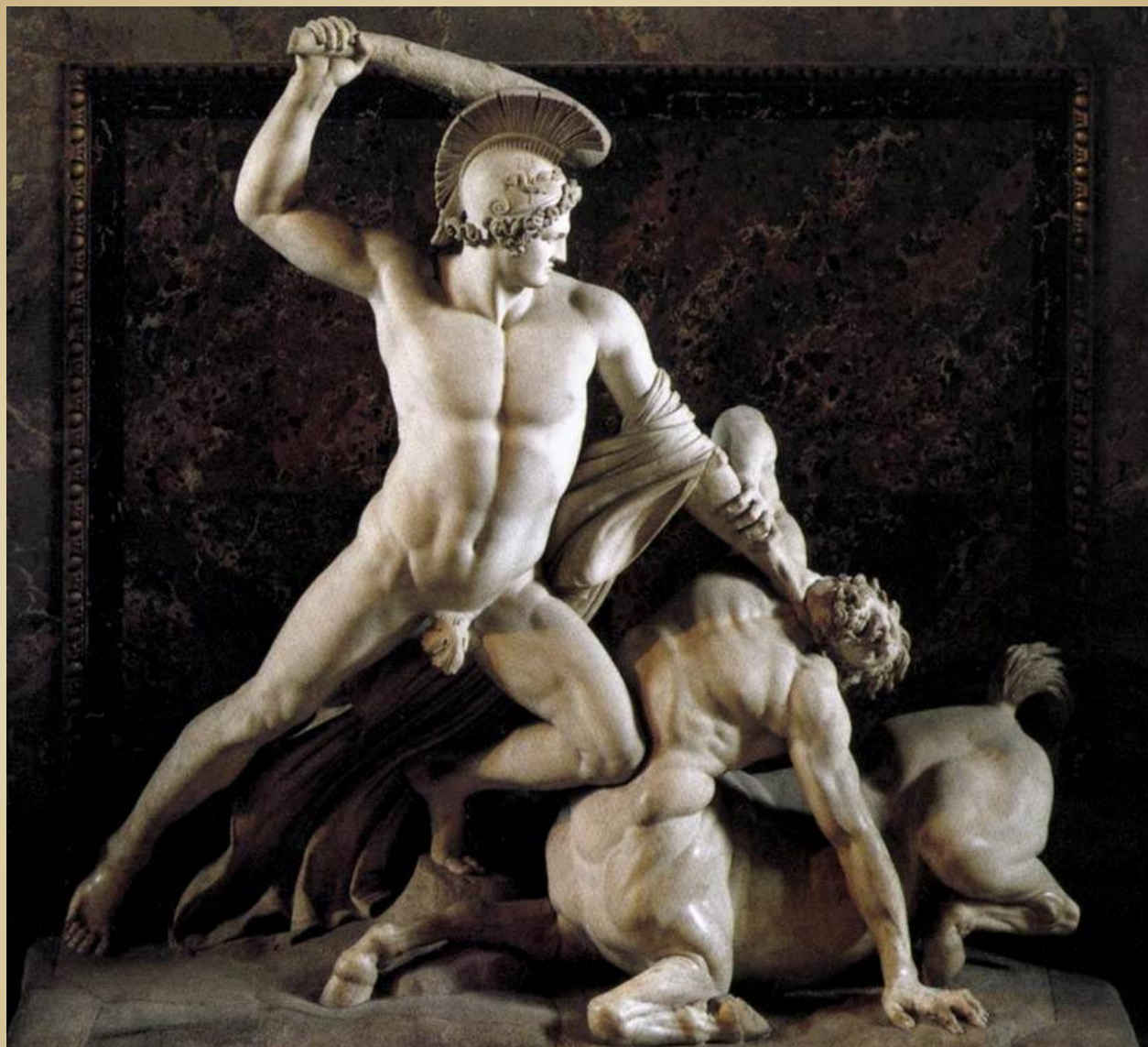
Антонио Канова Тесей и кентавр 1804-1819, Музей истории искусств, Вена