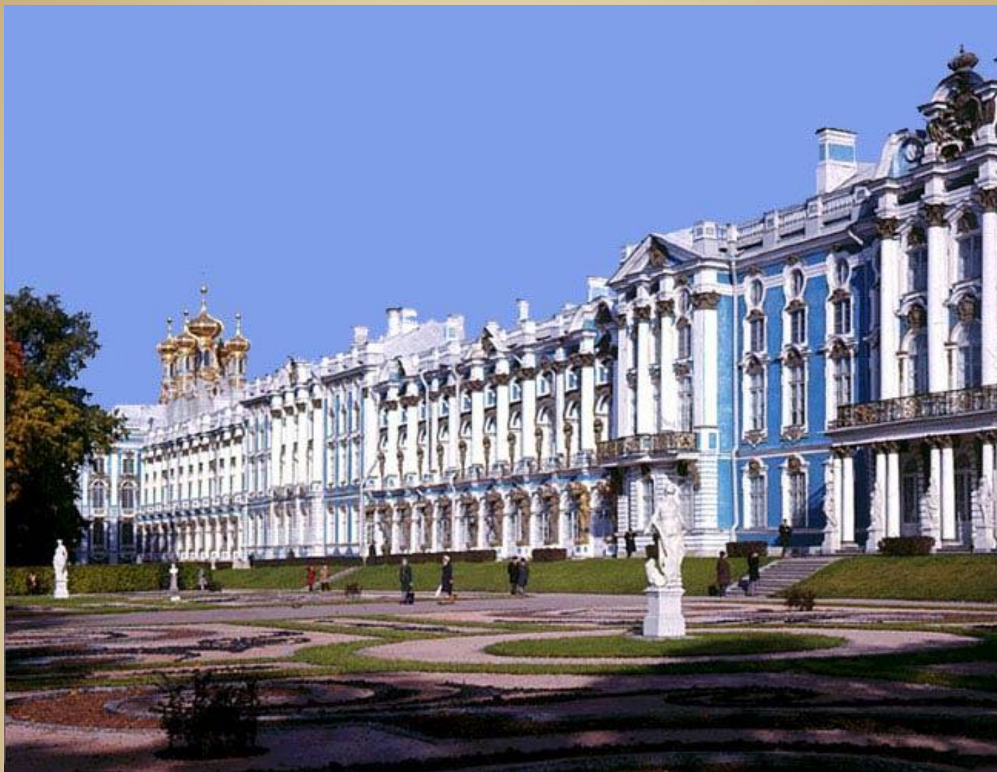
Екатерининский дворец Браунштейн, Квасов, Чевакинский, 1717-1756 Санкт-Петербург