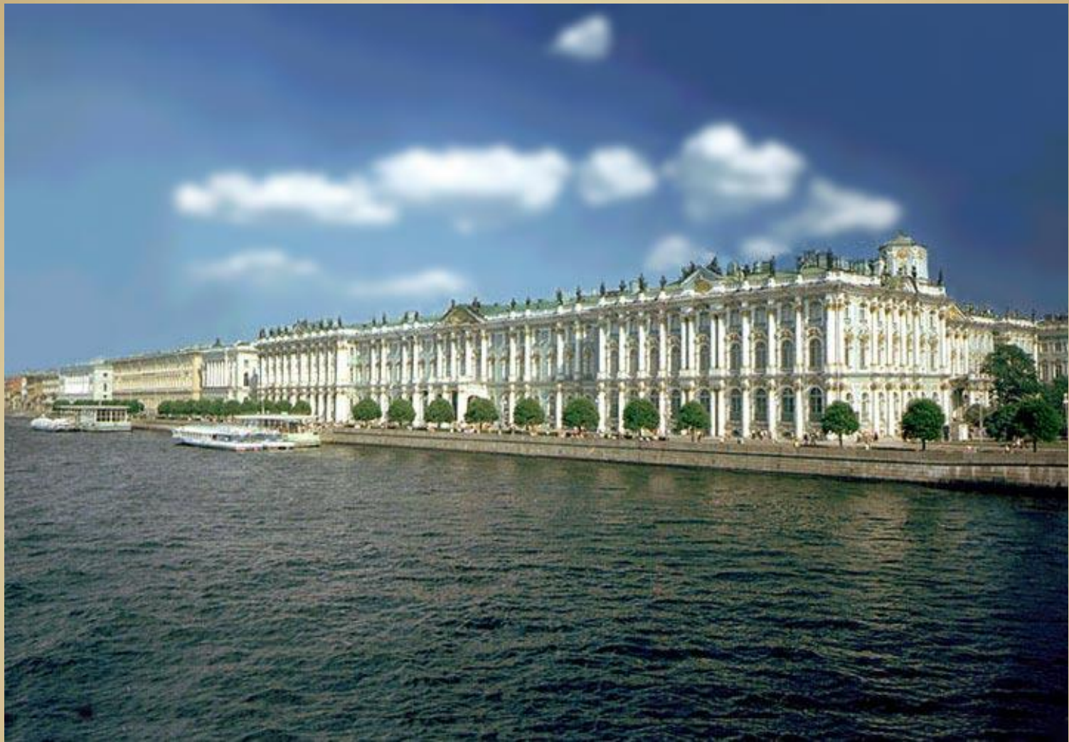
Зимний дворец Растрелли, Стасов, Брюллов, 1754-1762, 1838-1839 Санкт-Петербург