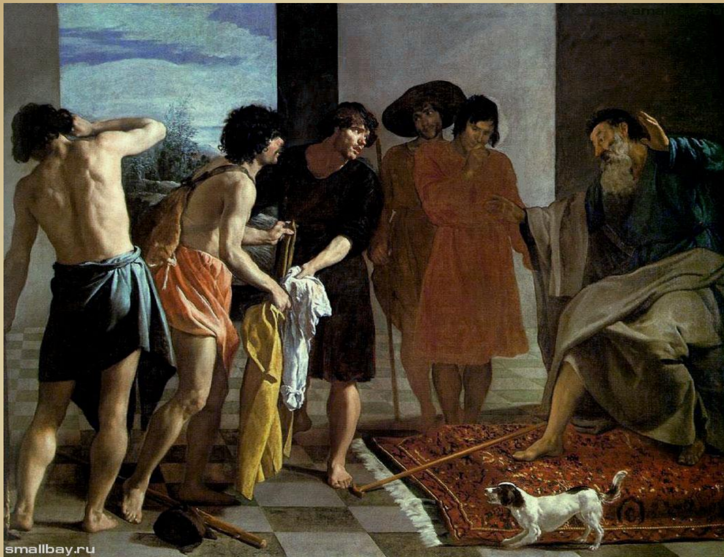
Окровавленный плащ Иосифа приносят Иакову