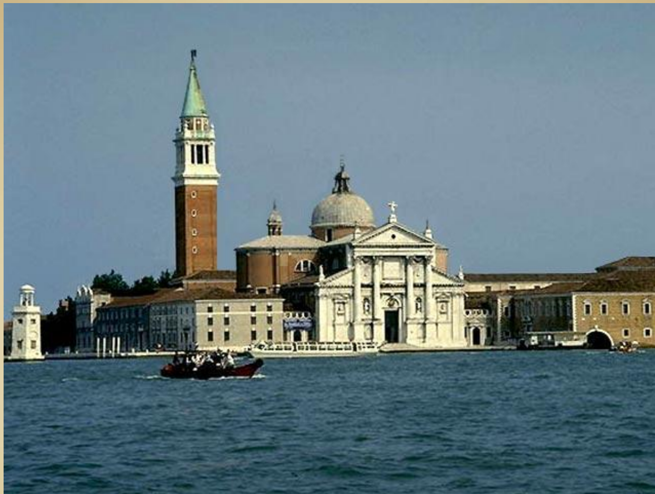
Церковь и монастырь Сан-Джорджо-Маджоре, Палладио, 1566 Венеция