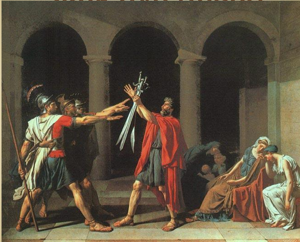
Клятва Горациев" 1784, Лувр, Париж