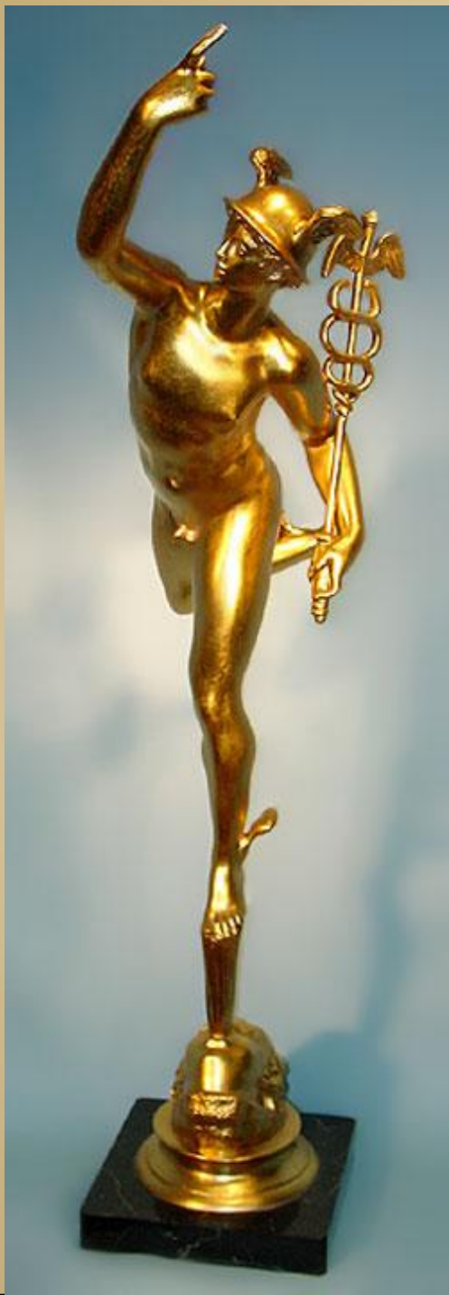
Джамболонья Меркурий, 1564, Городской музей, Болонья