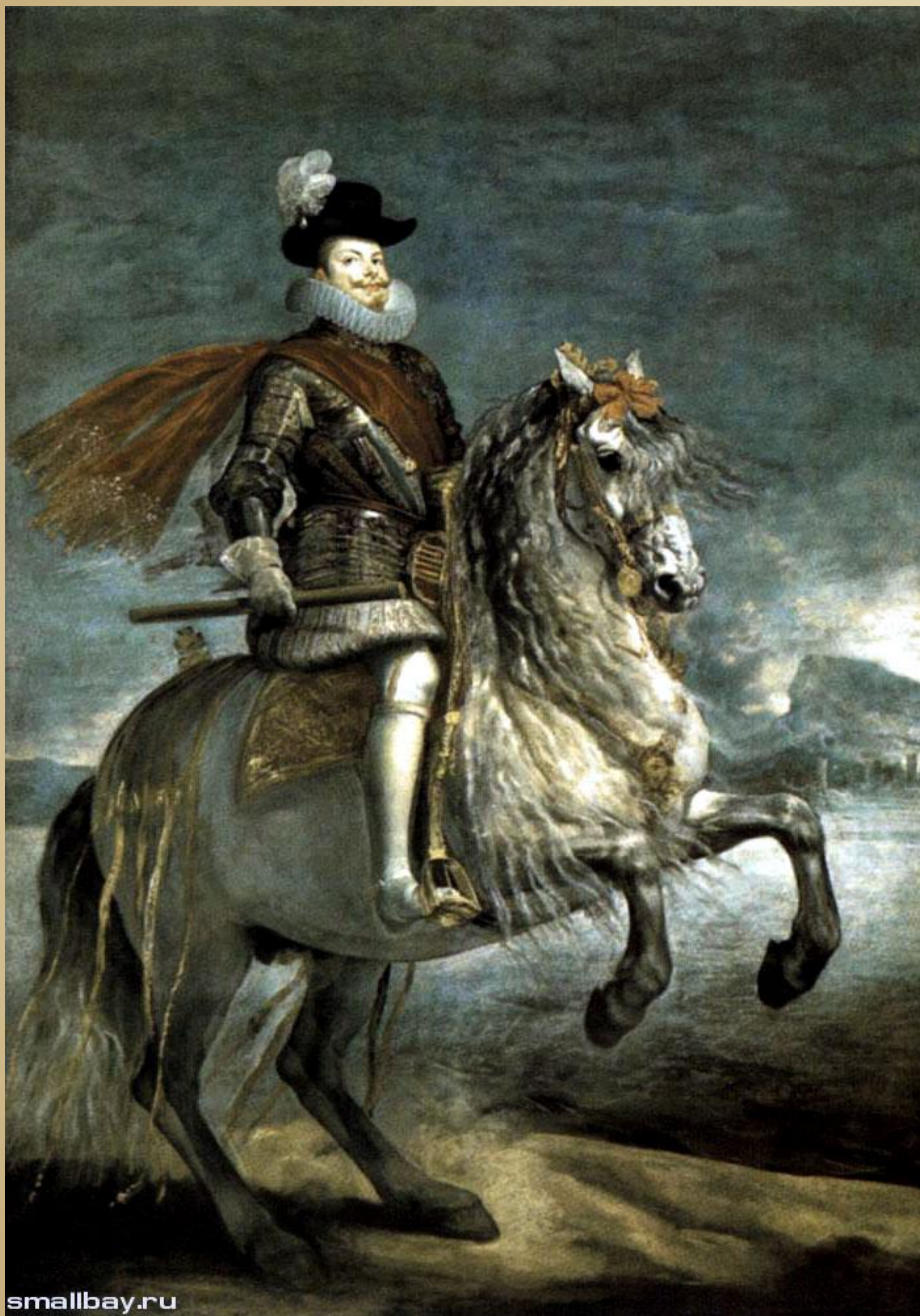
Портрет короля Филиппа III, 1635