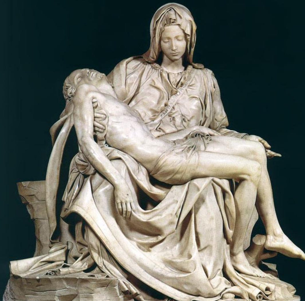
Микеланджело Пьета, 1497-1499, Собор св.Петра, Рим