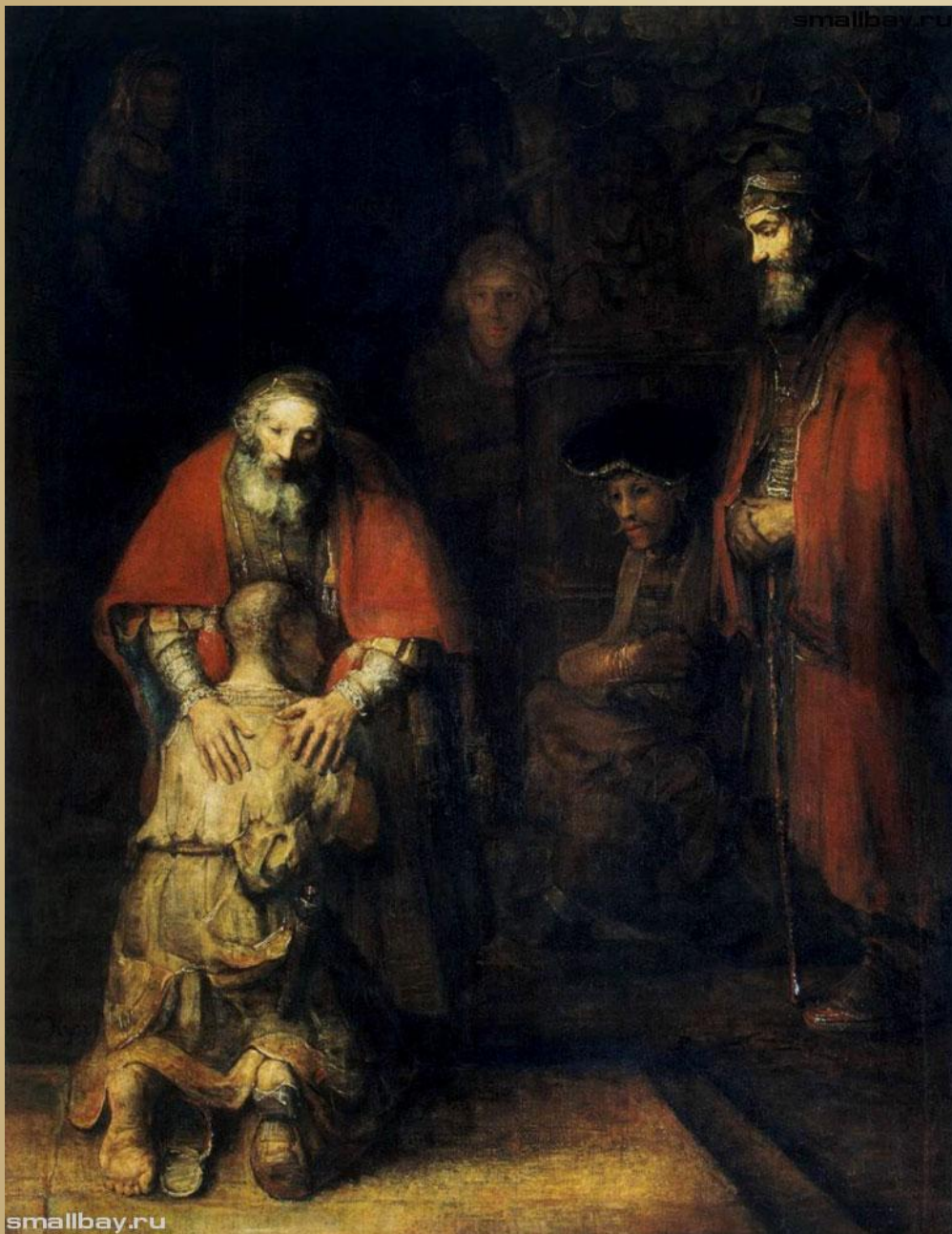
Возвращение блудного сына, 1669