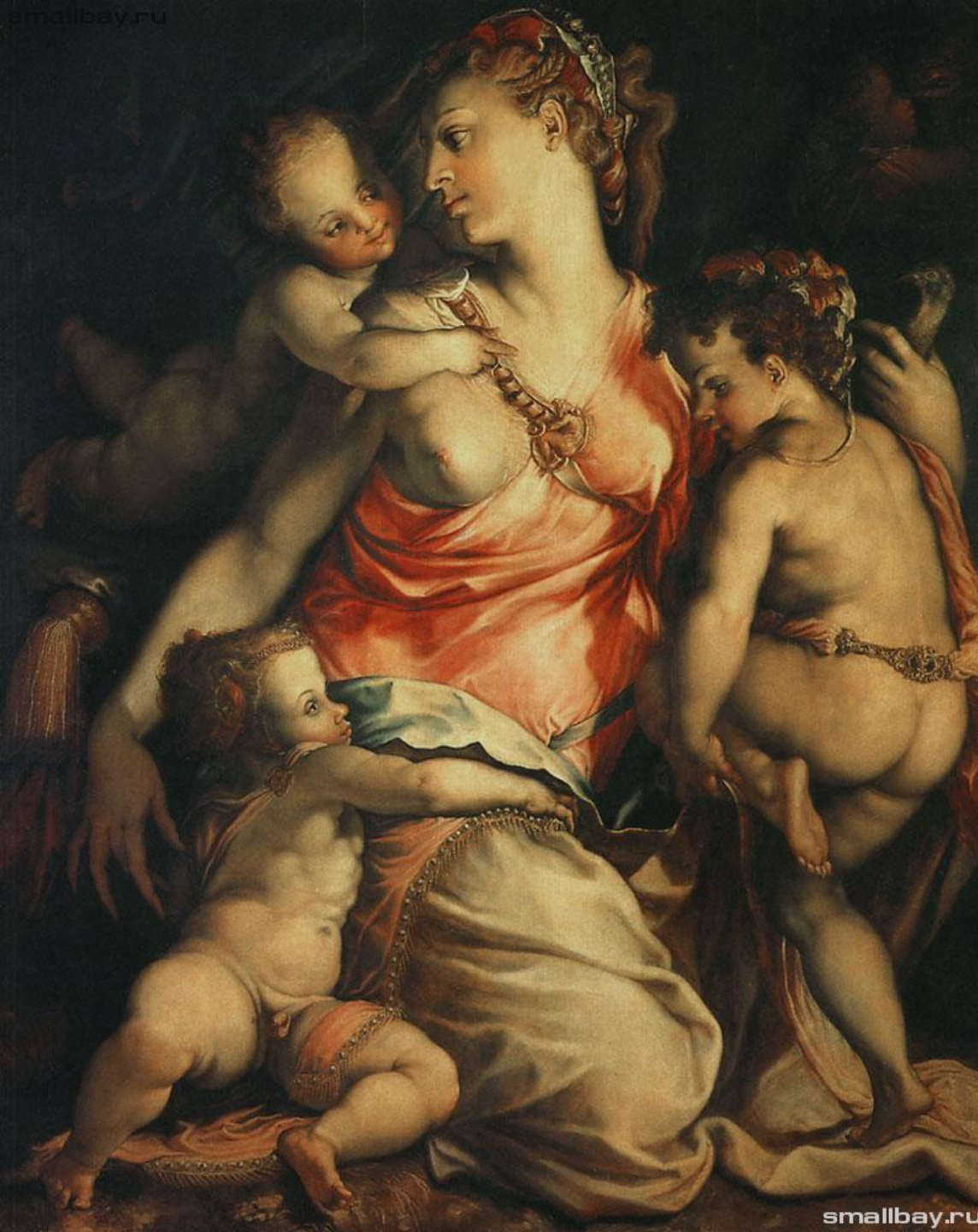
Сальвиати Франческо Аллегория милосердия 1554-1558