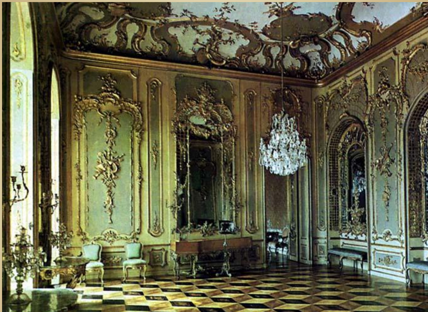
Интерьер дворца в стиле рококо