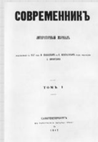
Литературный журнал «Современник»