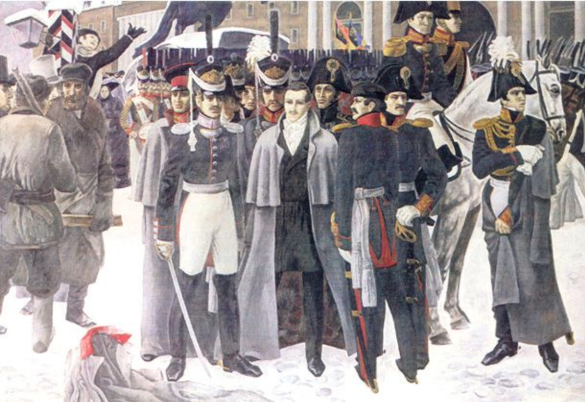
Декабристы на Сенатской площади.