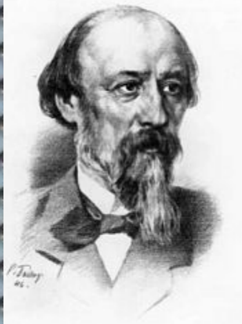
Н.А.Некрасов - редактор журнала "Современник".

В 50-е годы журнал «Современник» объединял вокруг себя крупнейших демократических и либерально настроенных писателей. К концу 50-х годов писатели умеренного направления окончательно порывают с журналом, и он становится органом революционной демократии. Идейным руководителем журнала стал Чернышевский. Революционно-демократический лагерь в литературе представляли также Герцен, Добролюбов, Некрасов, Салтыков-Щедрин. Им противостояли литераторы, тяготевшие к либеральным и умеренно монархическим взглядам. Наиболее значительными из них были Тургенев и Гончаров. Однако назревшая необходимость буржуазно-демократических преобразований и наличие демократического подъема в стране помогали в ряде случаев и этим художникам сохранить в своем творчестве глубину и силу социальной критики.