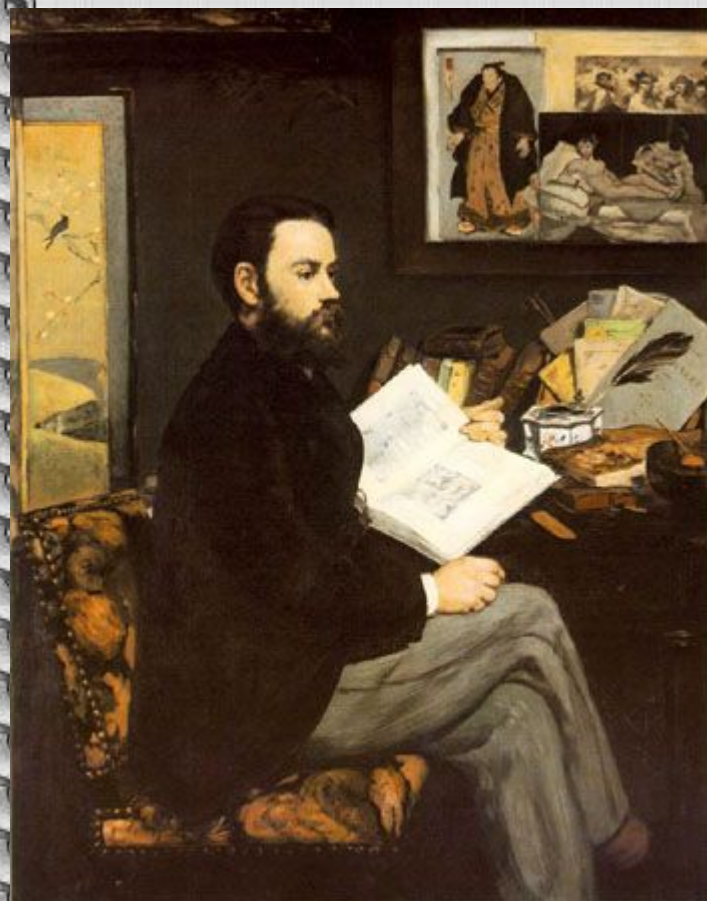
Э. Мане. Портрет Эмиля Золя

Русские художники не были отделены от того, что происходило за рубежом.