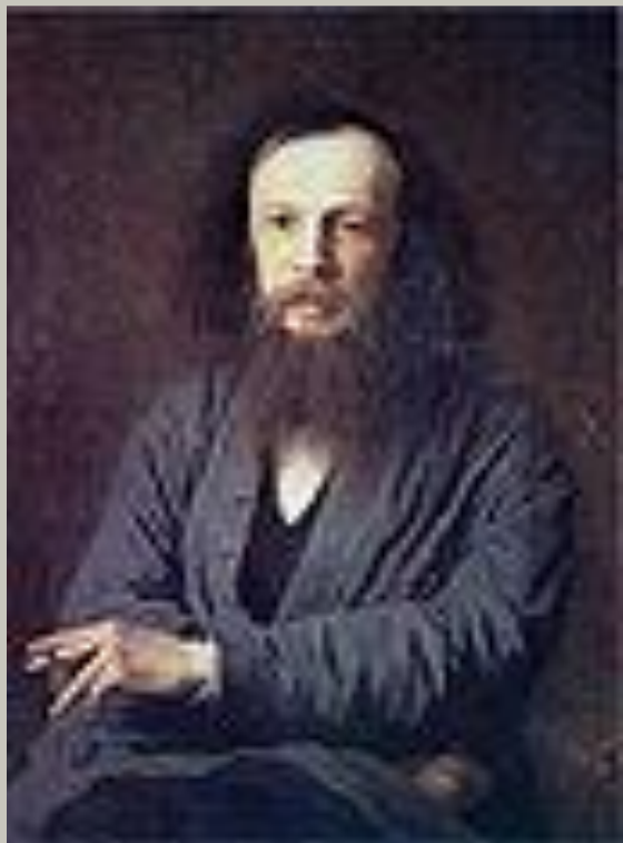
Портрет Д.И. Менделеева