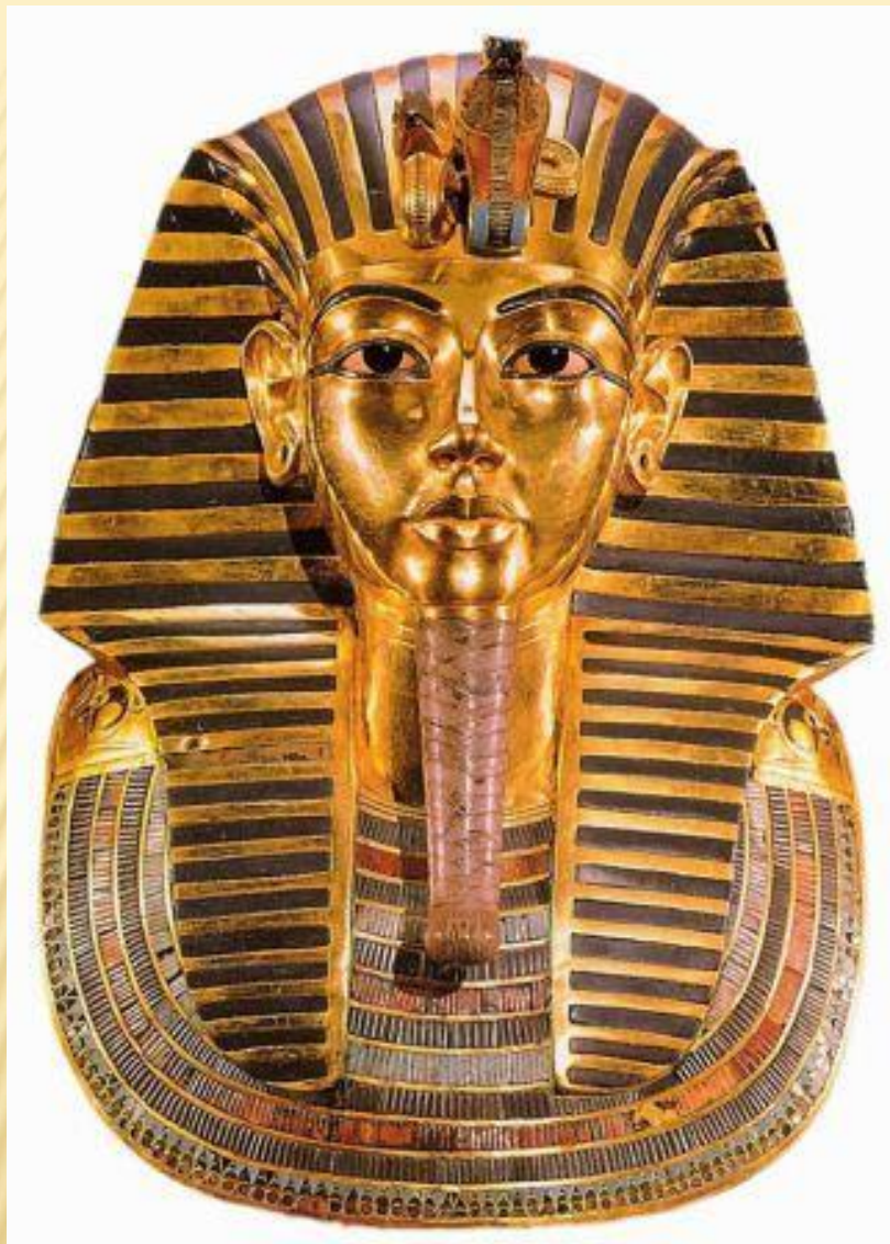
Погребальная маска египетского фараона Тутанхамона

У фараона были древнейшие головные уборы, которые практически не менялись во все времена, корона из двух частей (символы Нижнего и Верхнего царств) — атев, украшенная изображением коршуна и змеей — уреем — символом власти. Стоит отметить, что корон у фараона было великое множество (судя по дошедшим до нас фрескам, более 20), для различных религиозных обрядов, охоты, ведения военных операций. Другими царскими регалиями была треххвостая плеть и скипетр (в виде крючка). Следует заметить, что одним из символов власти фараона была борода, которая была искусственная, ее крепили за ушами завязками