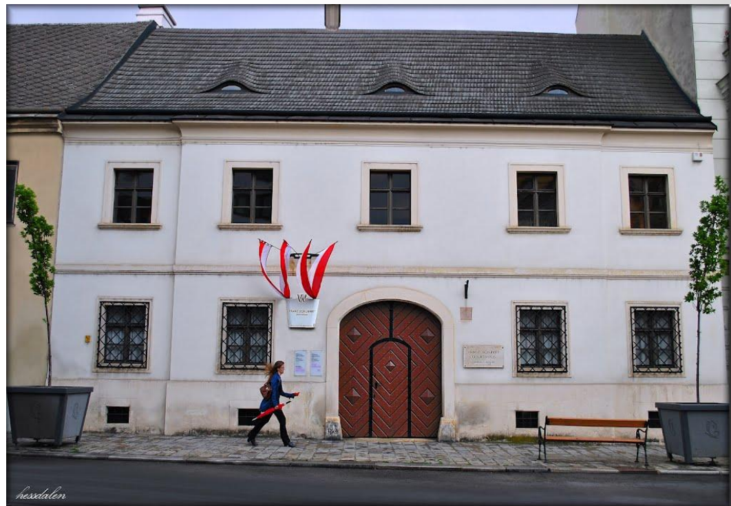
Дом где родился Ф.Шуберт