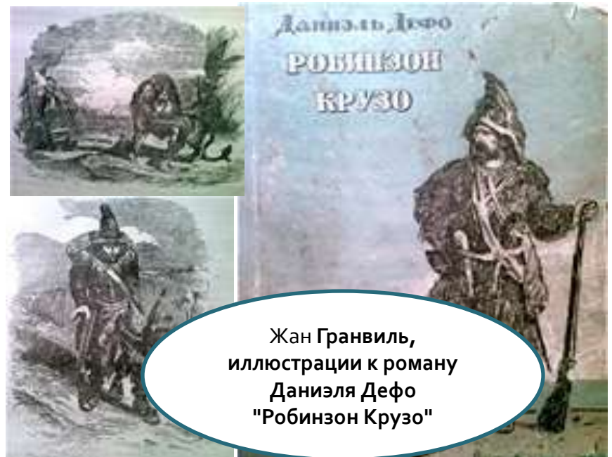
Жан Гранвиль, иллюстрации к роману Даниэля Дефо "Робинзон Крузо"