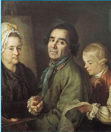
П.С.Дрождин. Портрет А.П. Антропова с сыном перед портретом жены Елены Васильевны