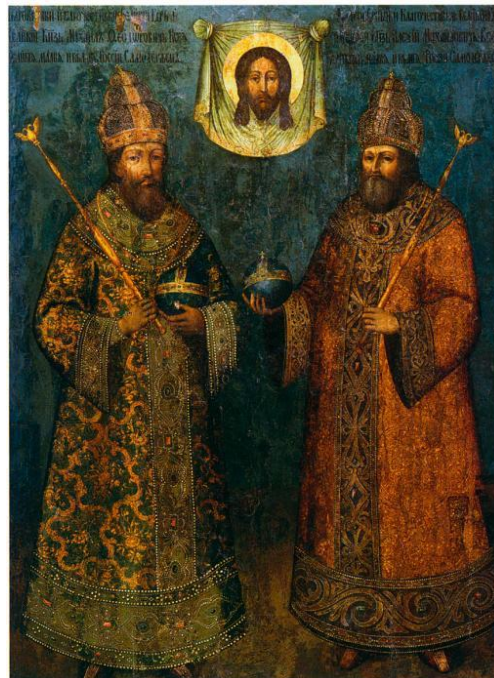
Царь Михаил Федорович и царь Алексей Михайлович, предстоящие перед образом Спаса Нерукотворного.