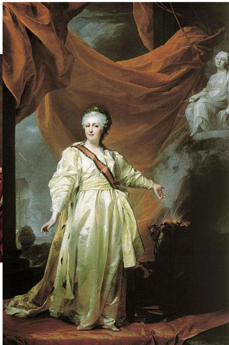
Екатерина II в виде законодательницы