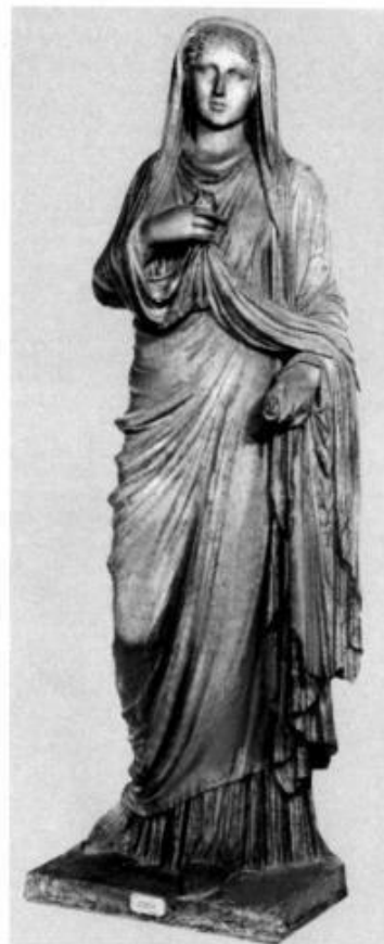
Статуя Эвмахины из Помпей. Неаполь.