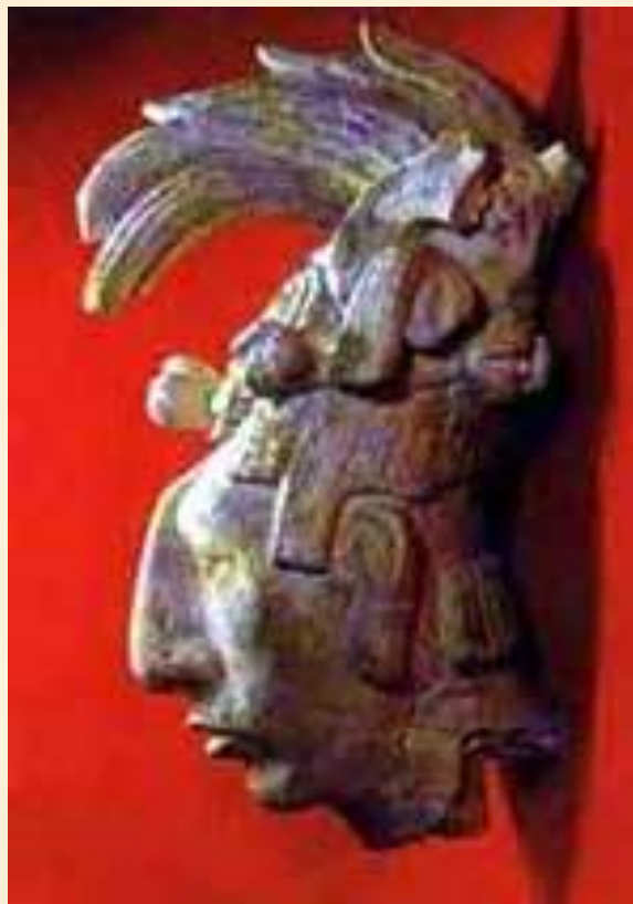
Голова правителя Пакаля. Рельеф