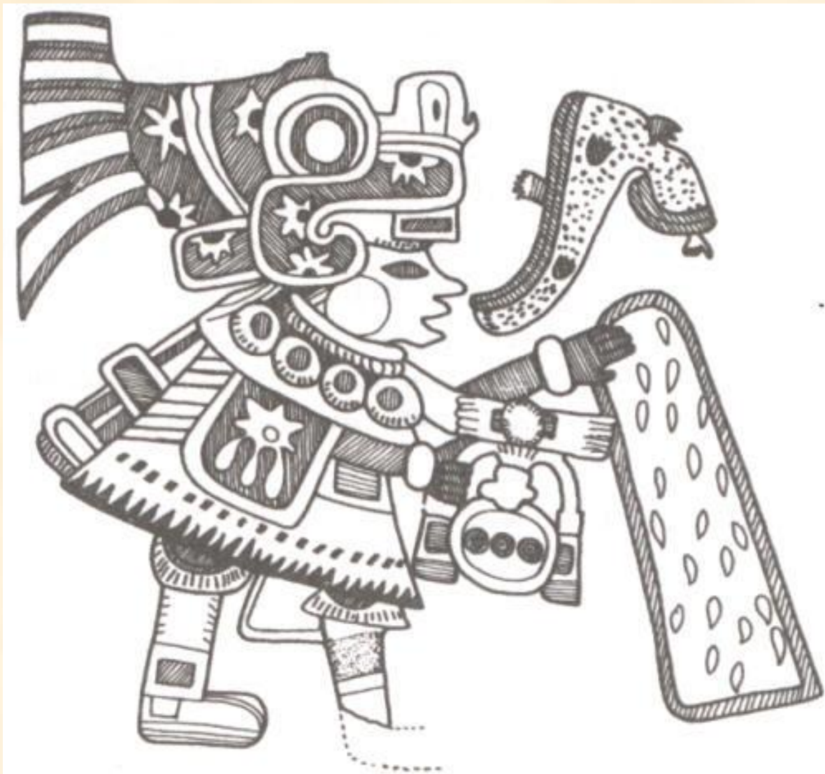
Поющий жрец в сцене ритуального сева (фреска), Теотиуакан