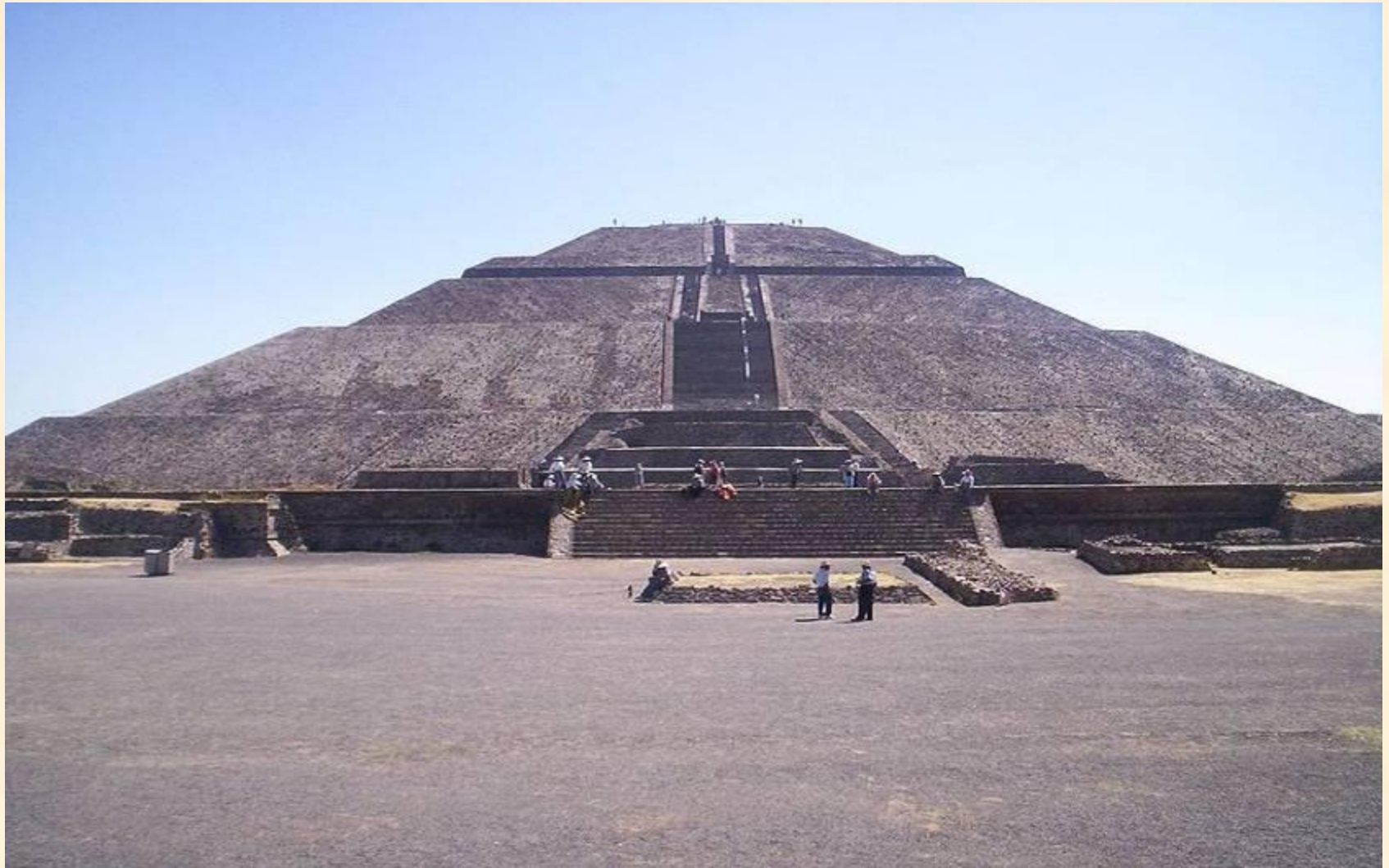
Пирамида Солнца, Теотиуакан