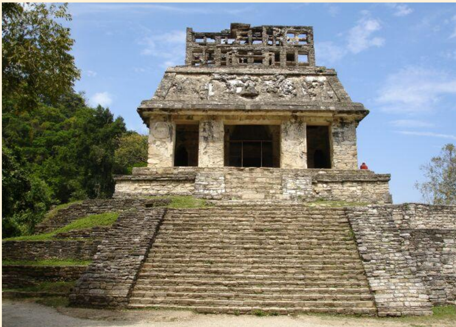
Храм Солнца, Паленке