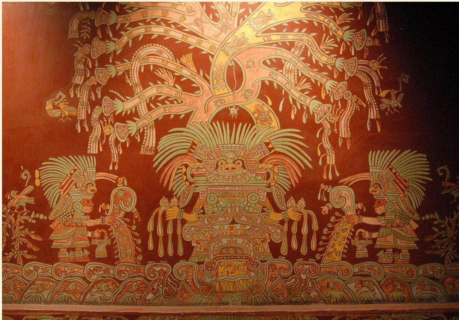
Великая богиня (фреска), Теотиуакан