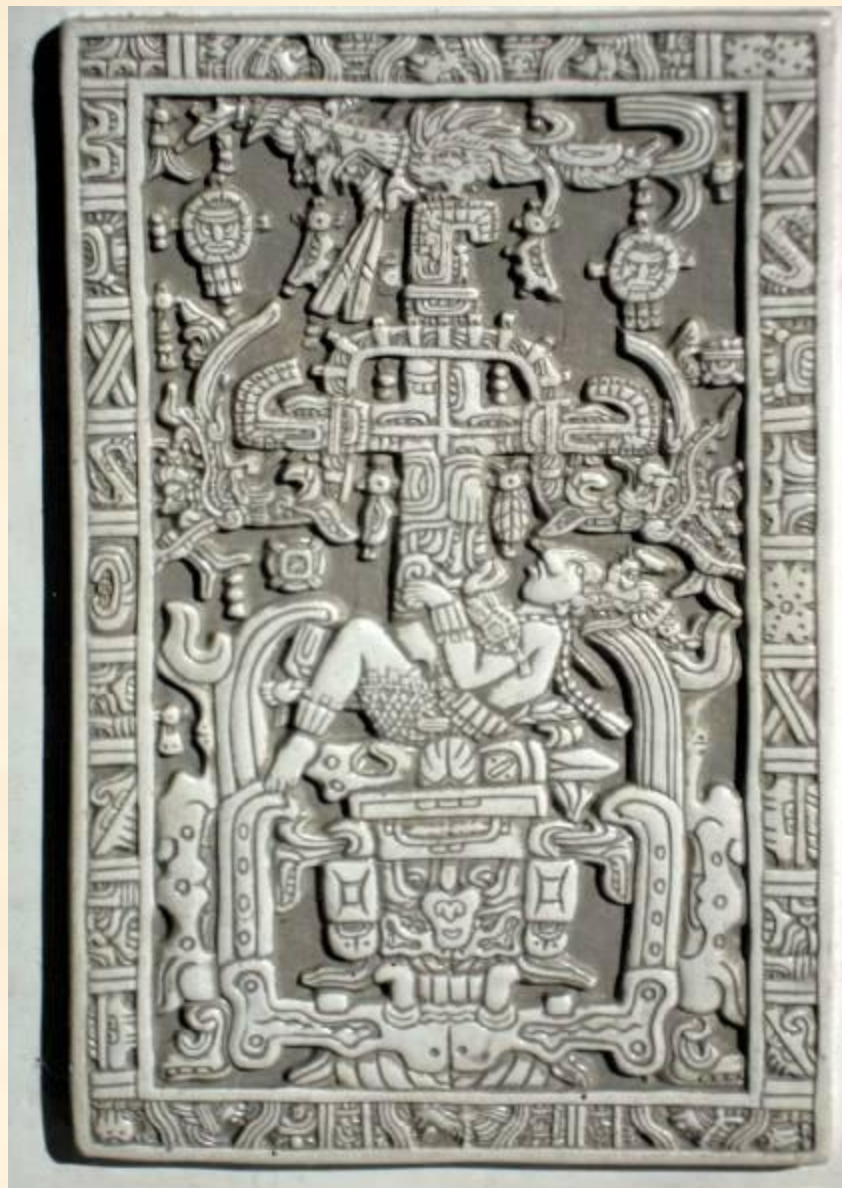
Крышка саркофага Пакаля II