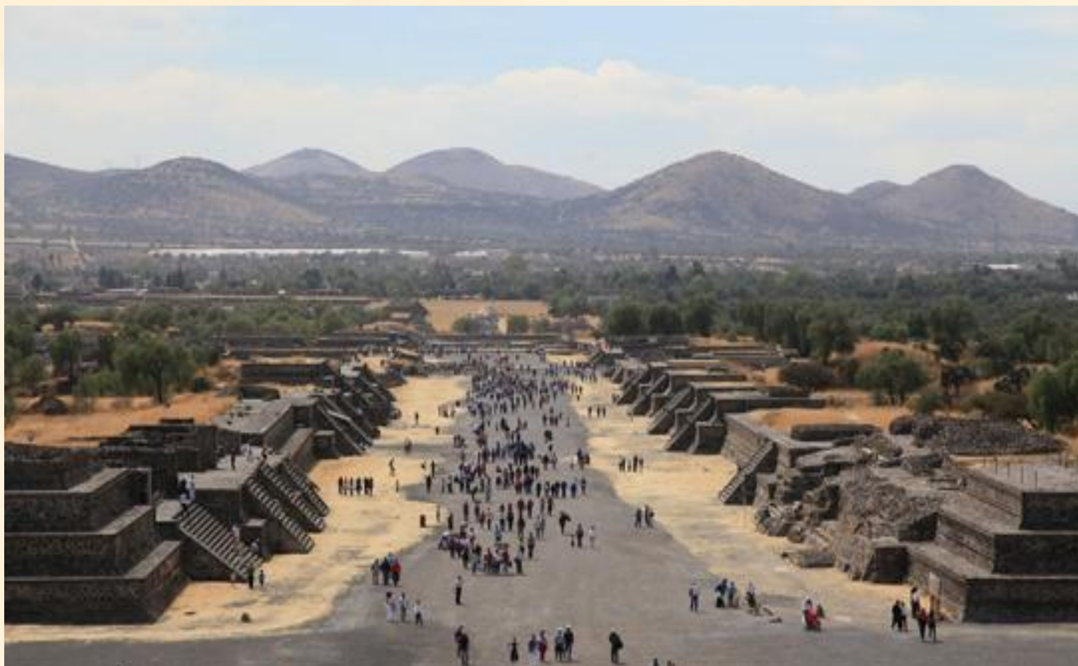
Дорога мёртвых, Теотиуакан