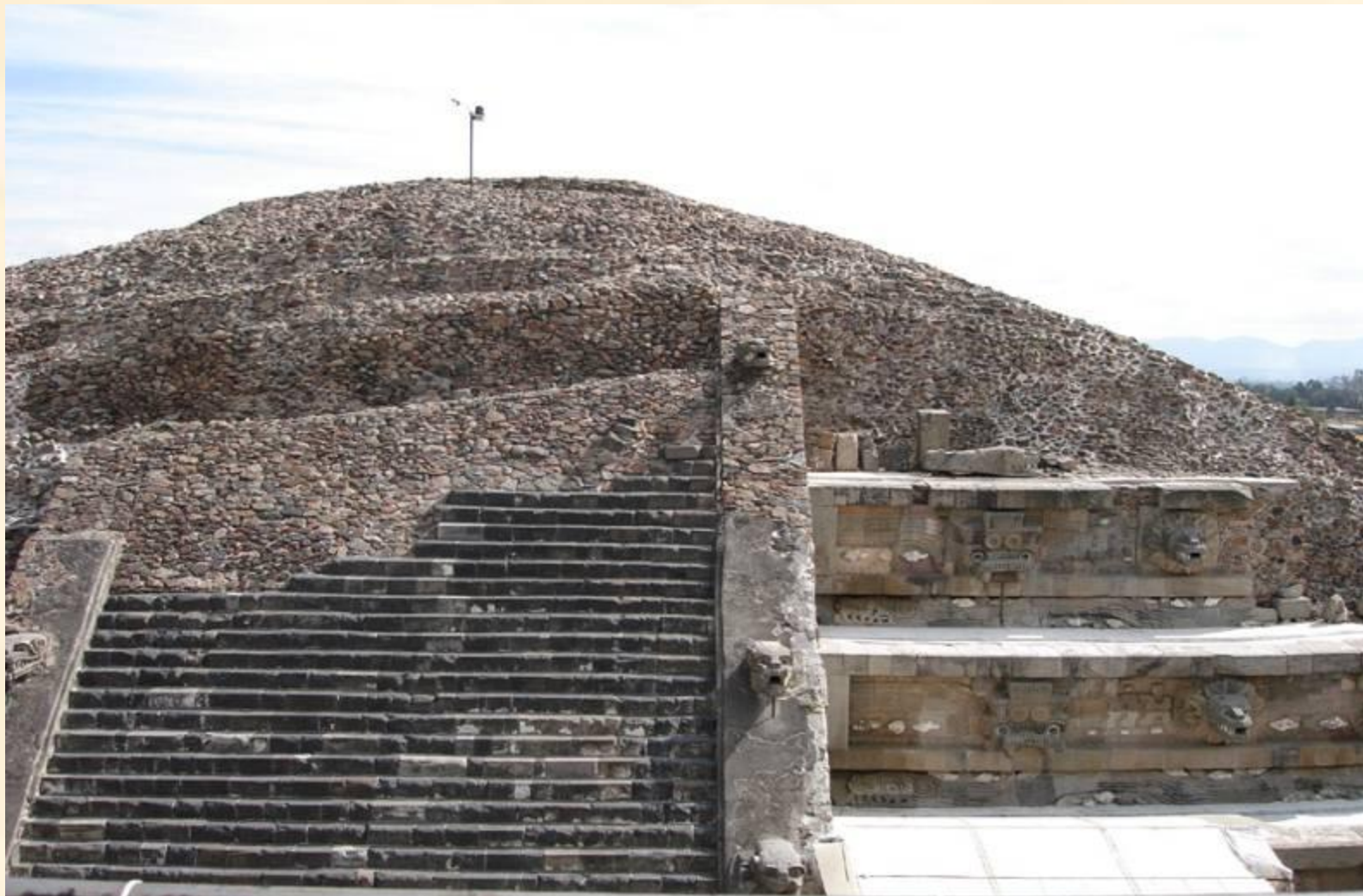
Храм Кецалькоатля, Теотиуакан