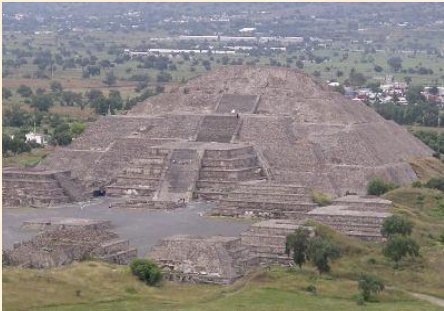
Пирамида Луны, Теотиуакан