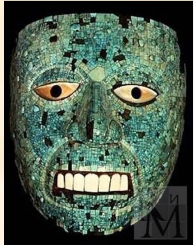
Погребальные маски ацтеков