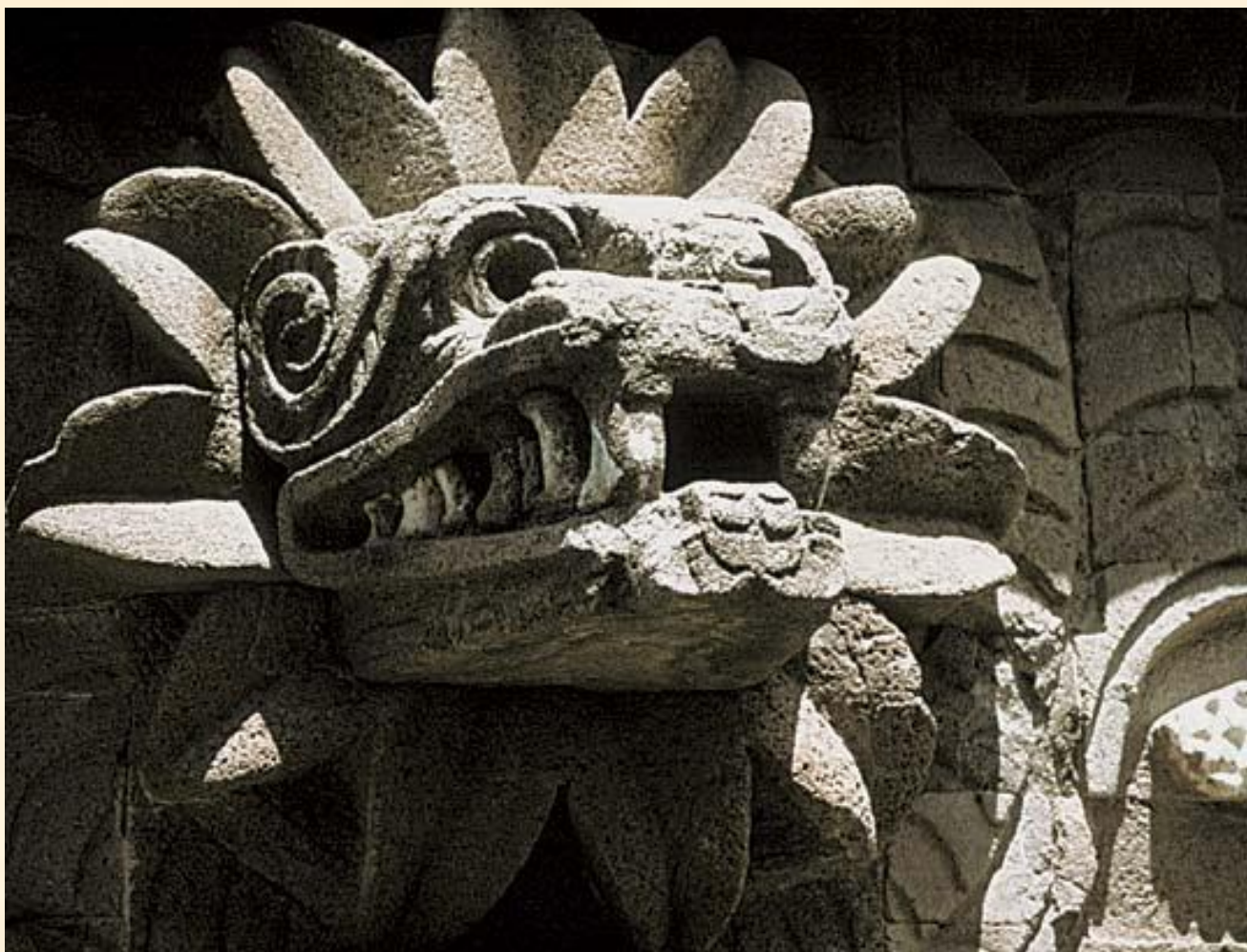
Каменное изображение Пернатого змея Храм Кецалькоатля, Теотиуакан