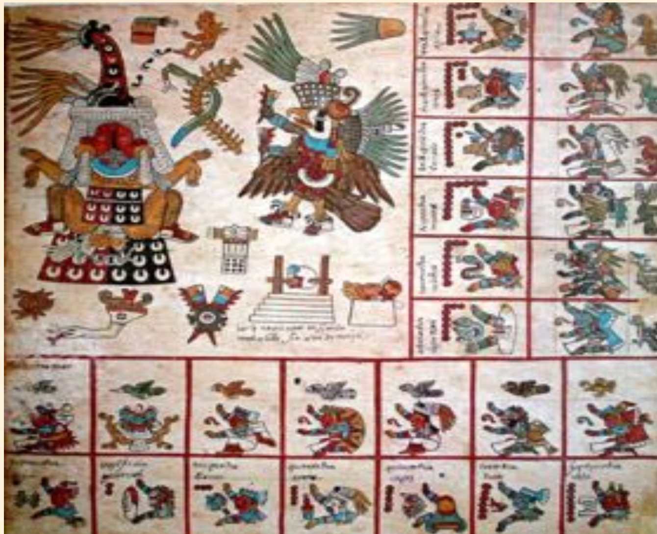
Ацтекский рисунок. Бурбонский кодекс