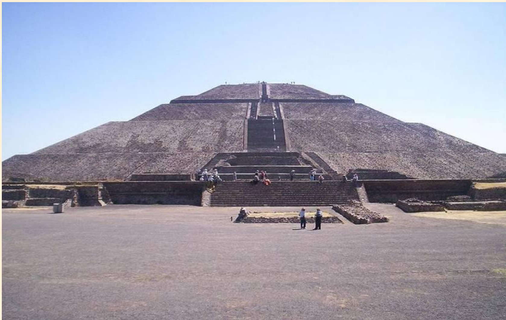
Пирамида Солнца, Теотиуакан