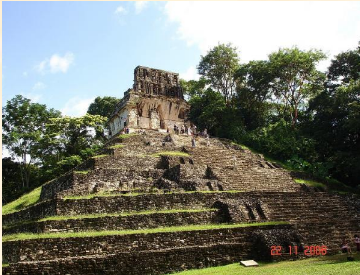
Храм Лиственного Креста, Паленке