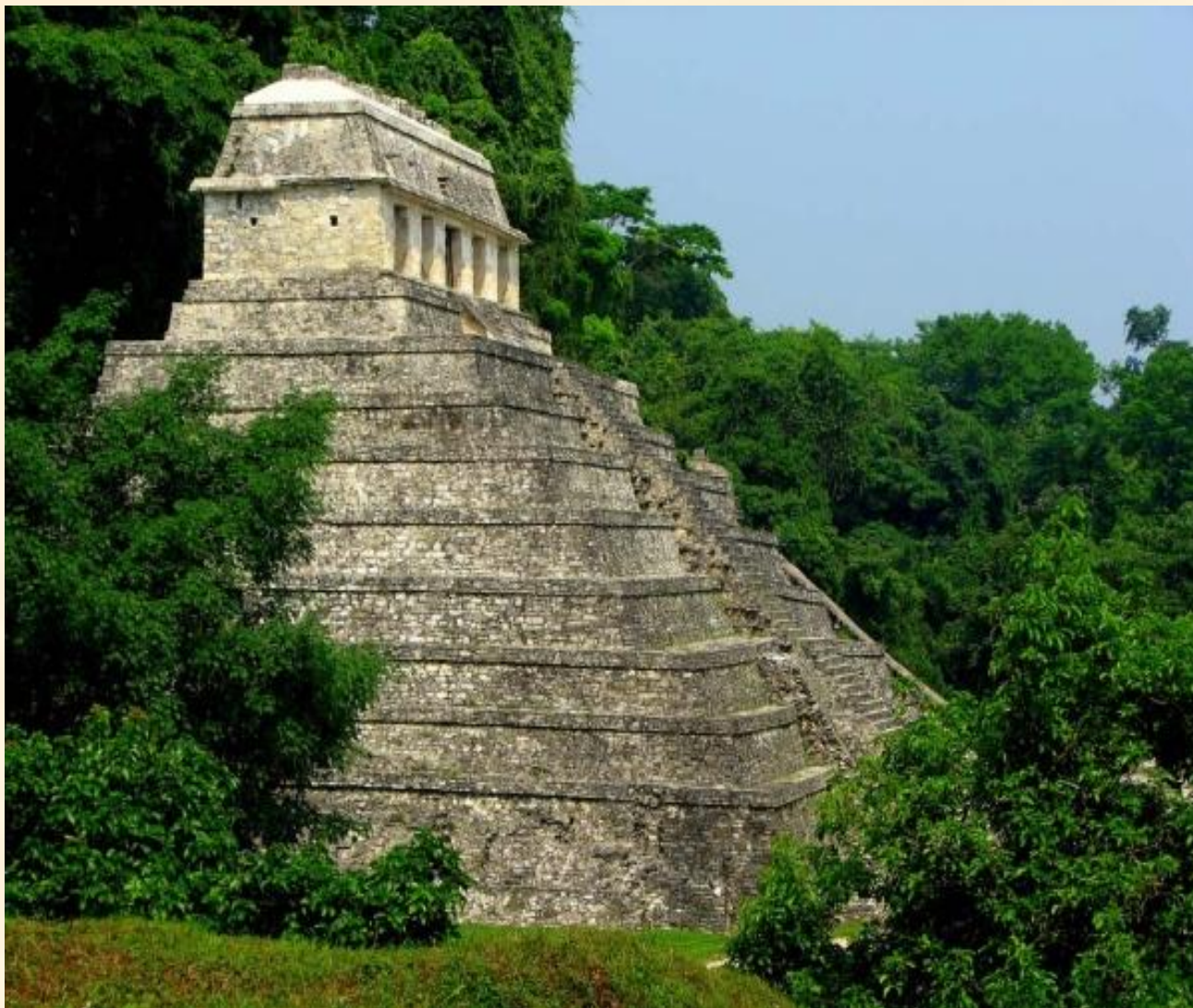
Храм Надписей, Паленке