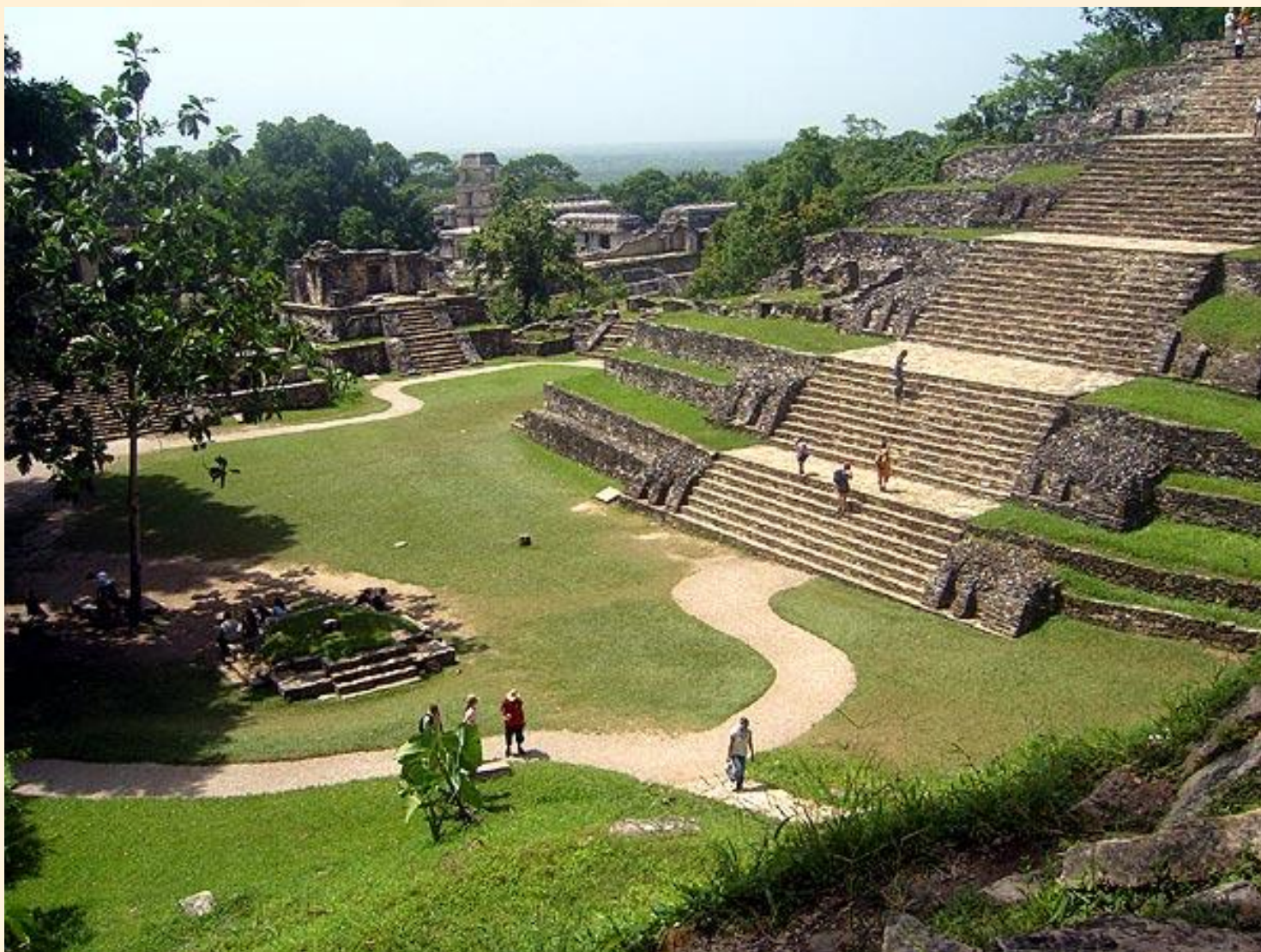
Храм Креста, Паленке