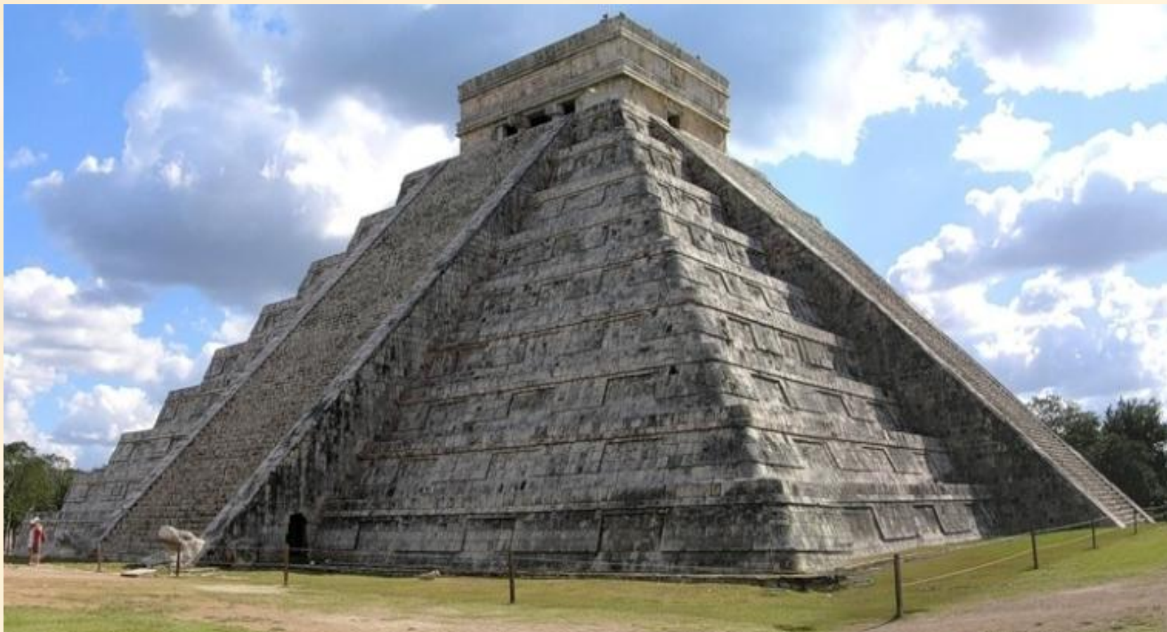
Пирамида Пернатого Змея, Теотиуакан