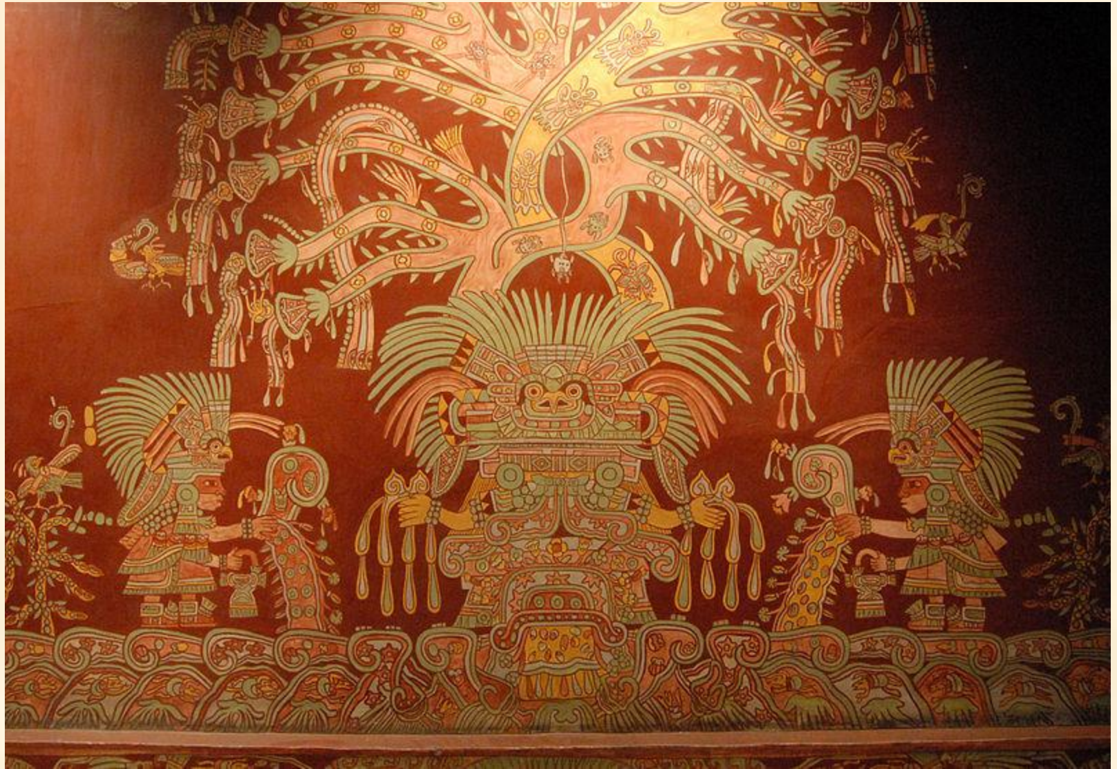
Великая богиня (фреска), Теотиуакан