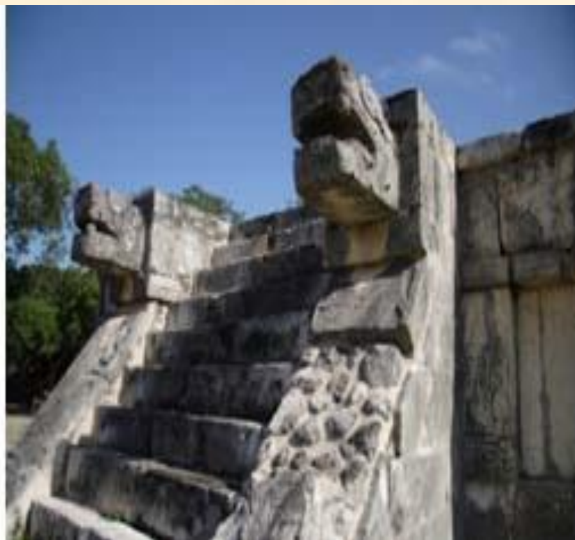
Храм Кецалькоатля, Теотиуакан