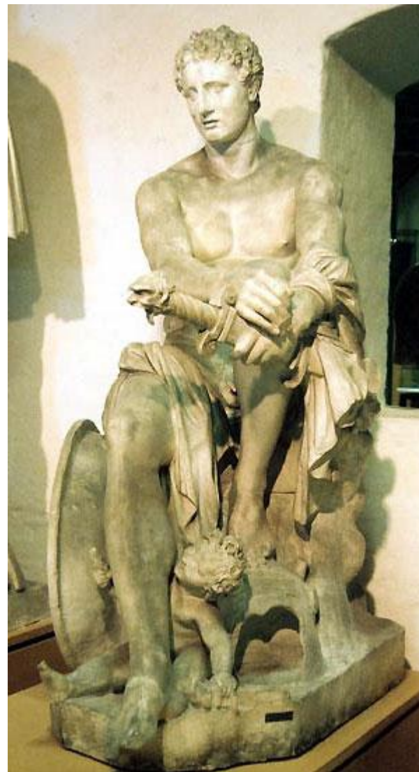
Арес Лоренцо Бернини, 1622