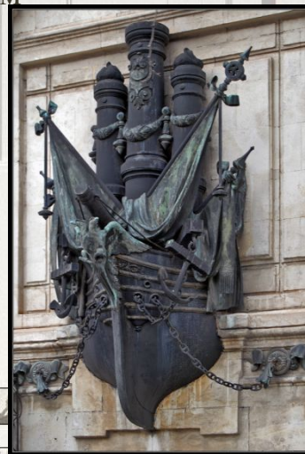
Музей истории Черноморского флота России