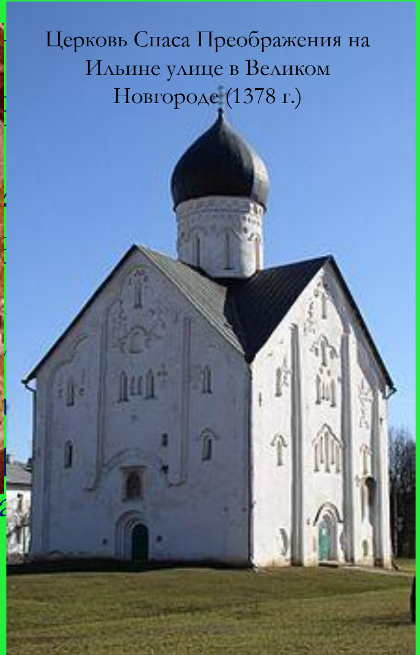
Церковь Спаса Преображения на Ильине улице в Великом Новгороде (1378 г.)

отличаются монументальностью и внутренней силой.