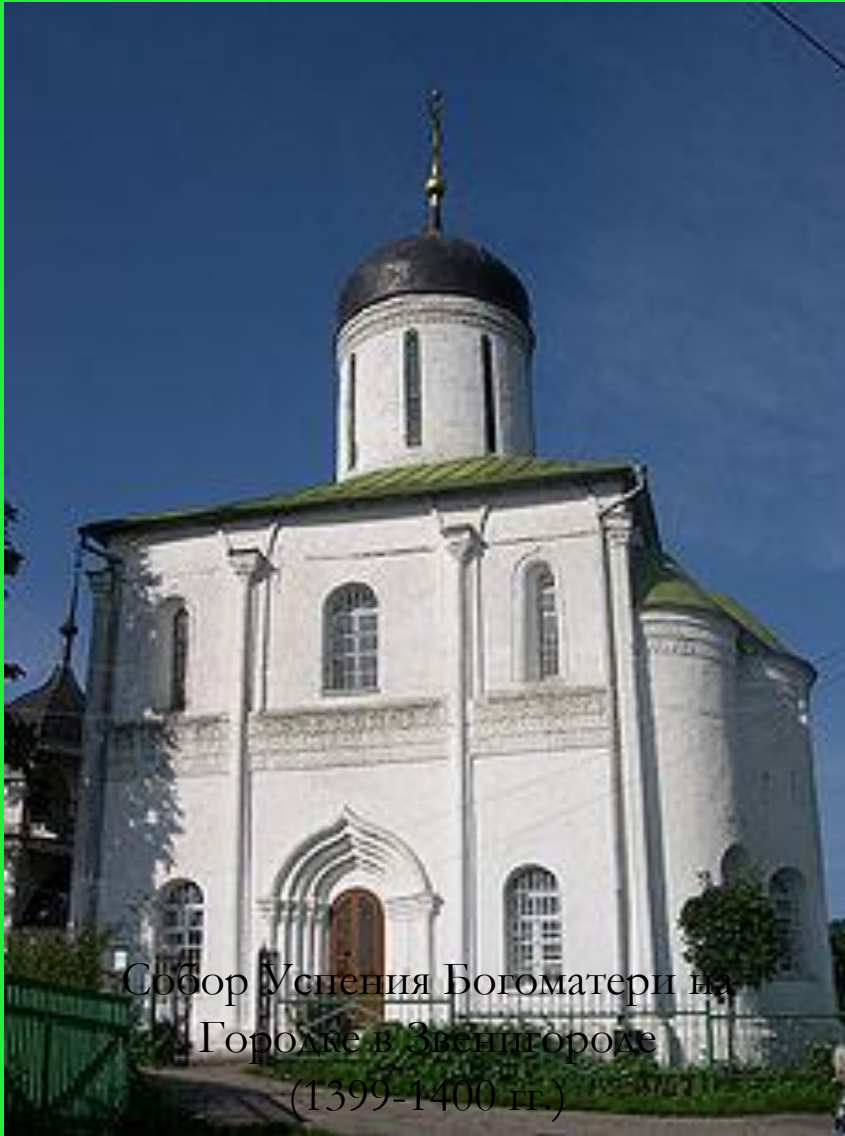
Собор Успения Богоматери на Городке в Звенигороде (1399-1400 гг.)