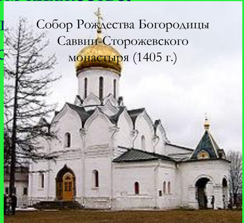
Собор Рождества Богородицы Саввин-Сторожевского монастыря (1405 г.)