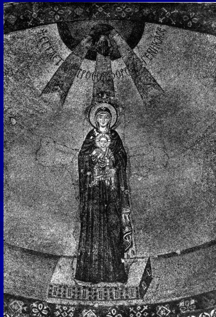
Богоматерь с младенцем. Мозаика абсиды церкви Успения в Никее. Вскоре после 787 г.