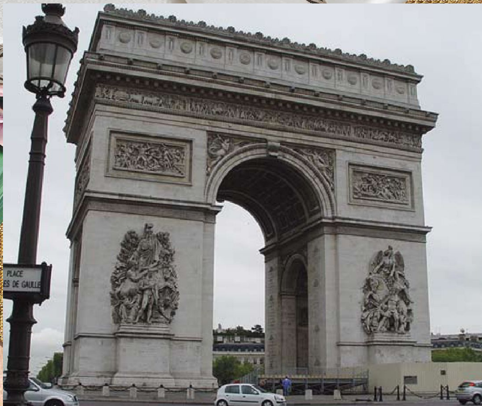
Триумфальная арка на Елисейских полях в Париже

По указу Наполеона I, который хотел обессмертить славу своей армии, построены Триумфальные ворота в Париже. На стенах арки выгравированы имена генералов, сражавшихся вместе с императором.