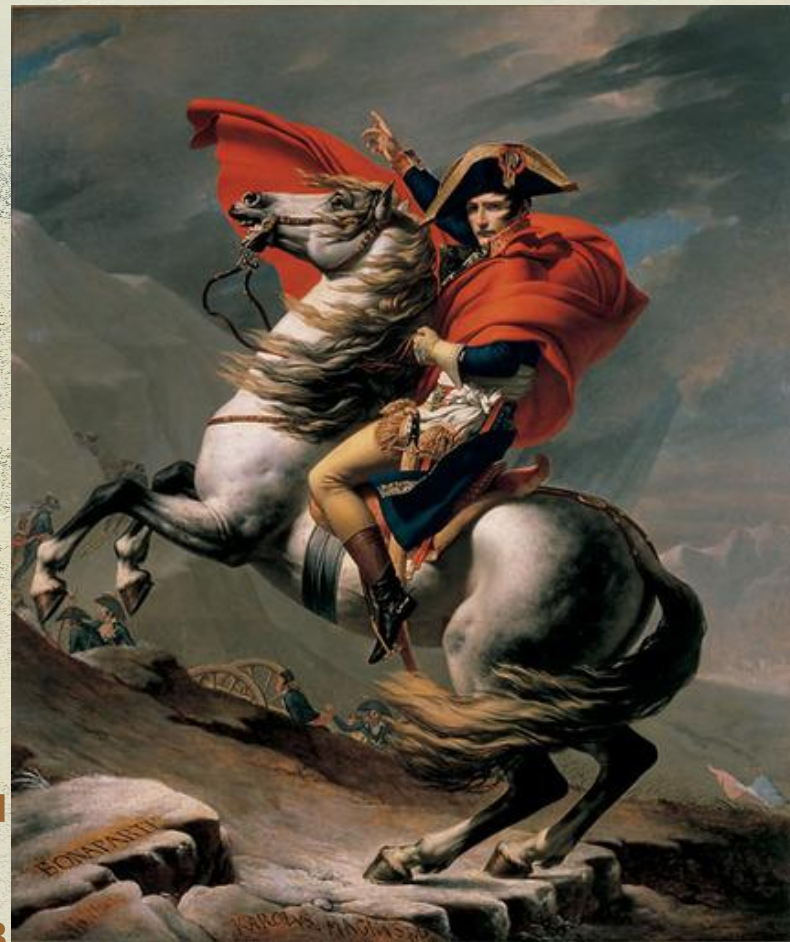
Луи Дэвид Наполеон верхом в С-Bernard Pass

По указу Наполеона I, который хотел обессмертить славу своей армии, построены Триумфальные ворота в Париже. На стенах арки выгравированы имена генералов, сражавшихся вместе с императором.