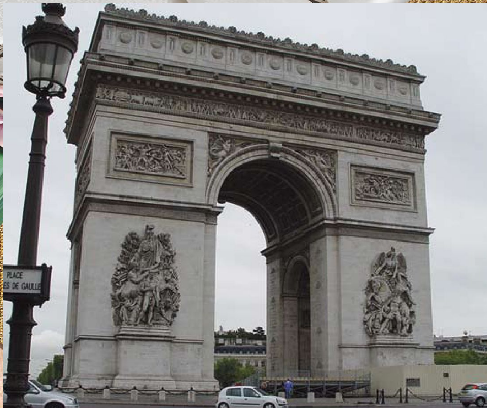
Триумфальная арка на Елисейских полях в Париже

По указу Наполеона I, который хотел обессмертить славу своей армии, построены Триумфальные ворота в Париже. На стенах арки выгравированы имена генералов, сражавшихся вместе с императором.