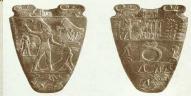
Палетка Нармера. Древний Египет

Искусство, как проявление свободных, творческих сил человека, полет его фантазии и духа часто использовалось для укрепления власти. Скульпторы, художники, музыканты в разные времена создавали идеализированные величественные образы правителей-вождей.