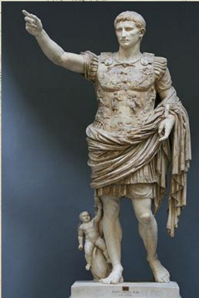
Август из Прима Порто. Римская статуя