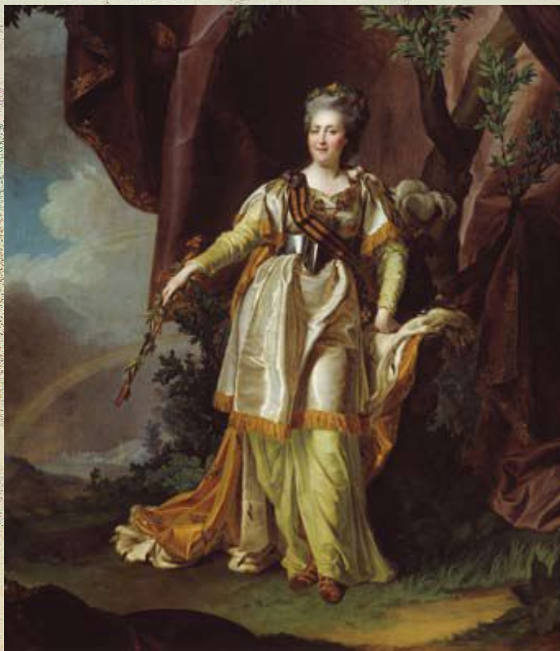
Д. Левицкий. Екатерина II

Двор московских царей становится местом проживания многих культурно образованных православных людей. В их числе архитекторы и строители, иконописцы и музыканты.