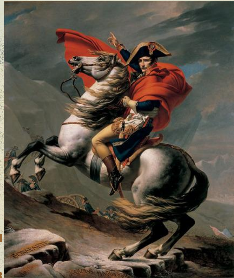
Луи Дэвид Наполеон верхом в C-Bernard Pass

По указу Наполеона I, который хотел обессмертить славу своей армии, построены Триумфальные ворота в Париже. На стенах арки выгравированы имена генералов, сражавшихся вместе с императором.