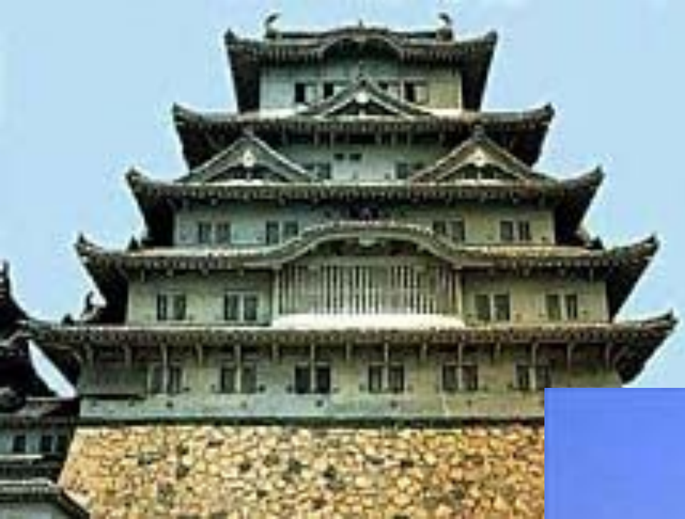
Замок Хакуродзе в Химедзи