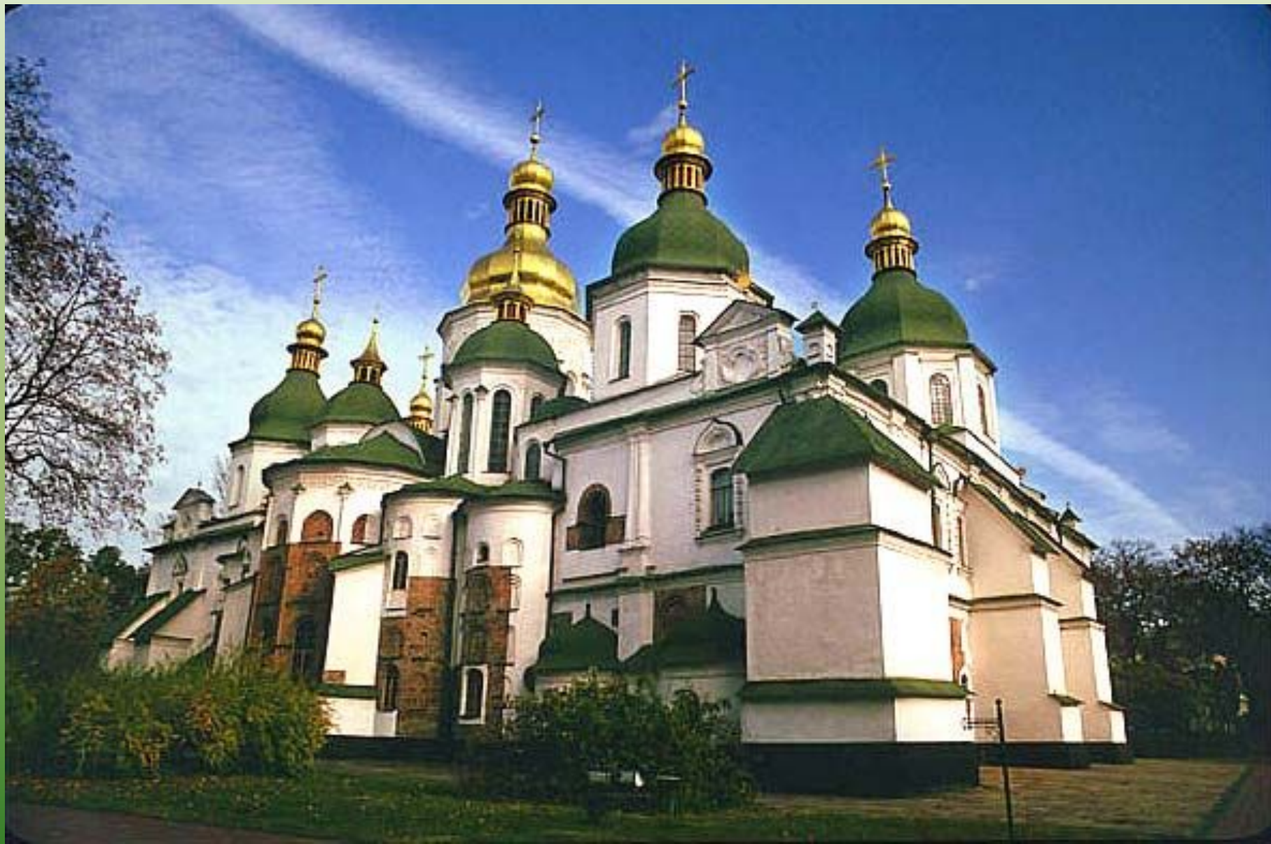
Софийский собор в Киеве