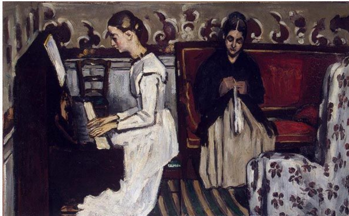
● «Девушка у пианино»