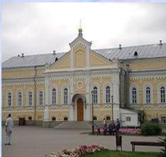
Трапезный храм во имя святого благоверного князя Александра Невского

В обители проживает более 400 насельниц. С 1989 года в Дивееве было восстановлено и освящено семь храмов. Центром духовной жизни остается Троицкий собор со своей главной святыней — святыми мощами преподобного Серафима, Саровского чудотворца.