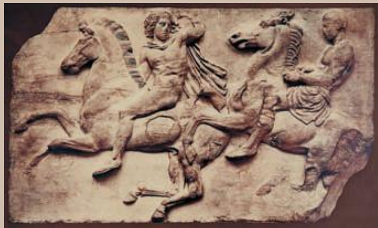
Фидий и помощники. «Всадники». Рельеф фриза Парфенона. Мрамор. 438—32 гг. до н.э. Британский музей. Лондон. Фрагмент