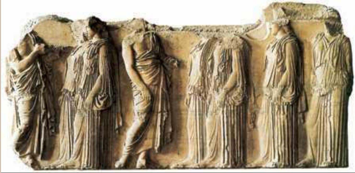
Фидий и помощники. «Панафинейское шествие». Рельеф фриза Парфенона. Мрамор. 438—32 гг. до н. э. Британский музей. Лондон. Фрагмент