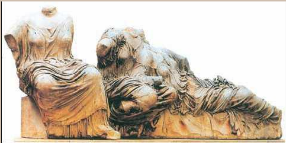
«Мойры». Фрагмент скульптуры восточного фронтона Парфенона. Мрамор. 438 - 432 до н.э. Британский музей. Лондон.