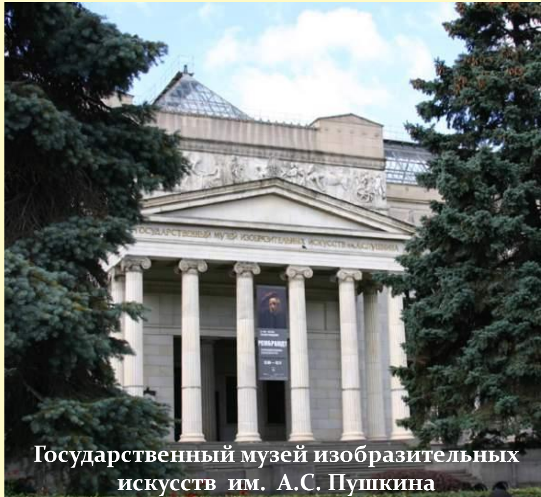
Государственный музей изобразительных искусств им. А.С. Пушкина