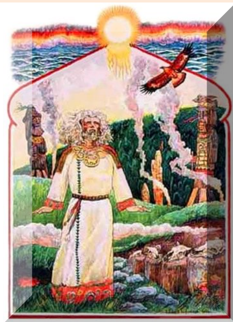
Бог солнца Хорос