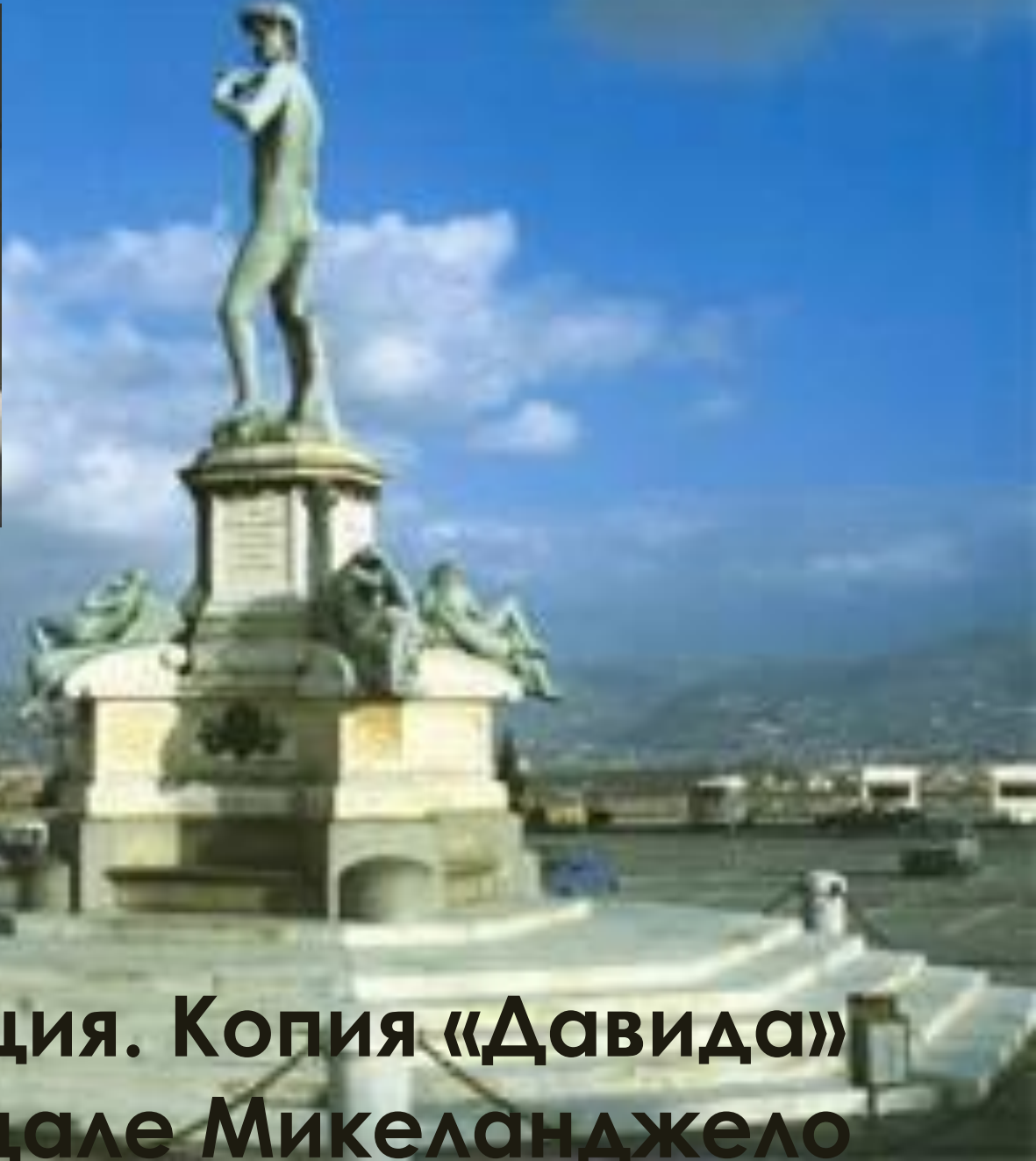
Флоренция. Копия «Давида» на пьядцале Микеланджело