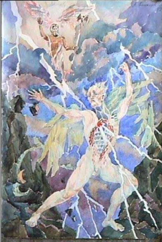
Зевс поражает титана акварель, 1992

Титаны являлись предшественниками олимпийских богов и в этом они сходны с етунами- хримтурсами (скандинавская мифология) и асурами (индийская мифология)