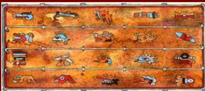
Рисунок на коже календаря ацтеков