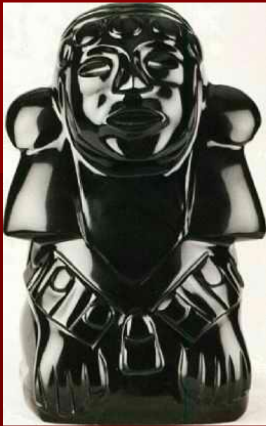
Фигурка Эхекатля - бога ветра

Изображение Тецкатлипоки Человеческий череп, инкрустированный бирюзой, нефритом, обсидианом и перламутром