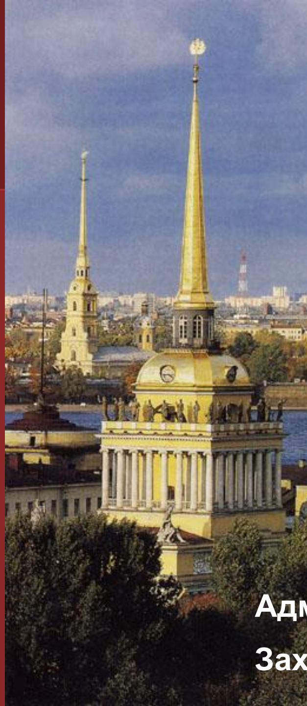
Адмиралтейство Захаров А.Д.