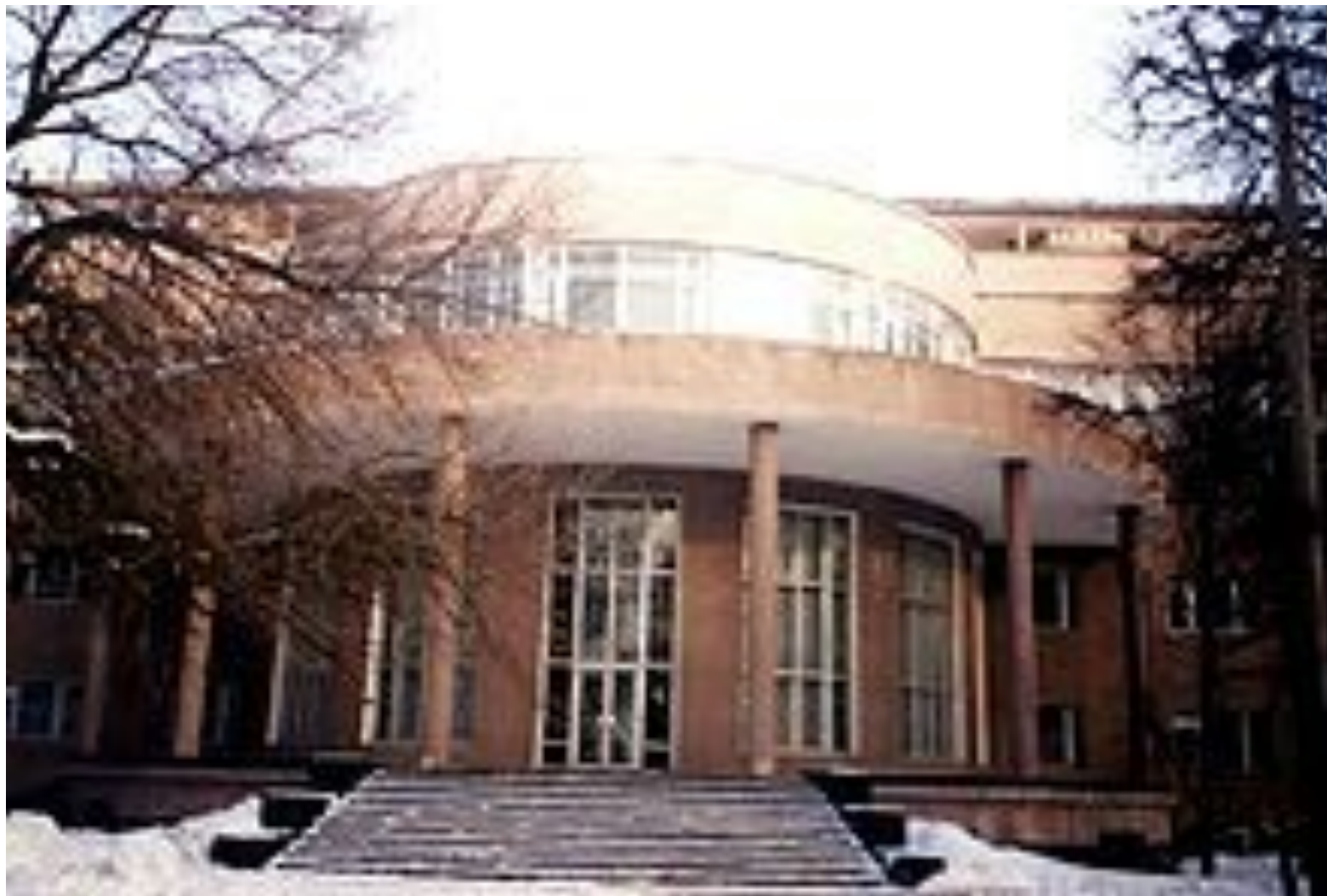
Дом Культуры ЗИЛ. Арх. братья Веснины