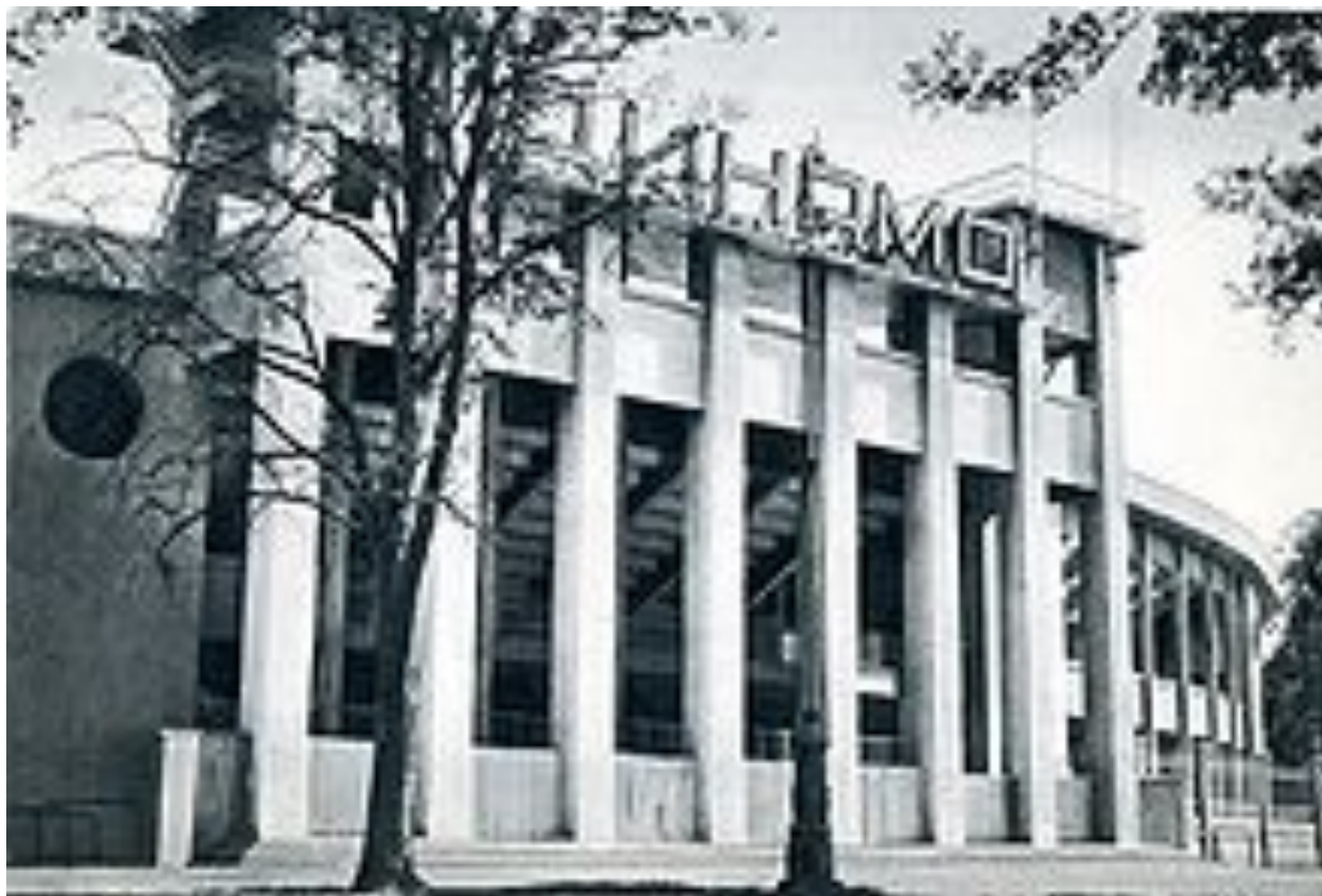
Стадион «Динамо», Москва