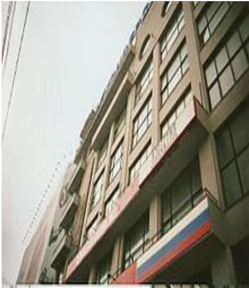
Здание газеты «Известия»