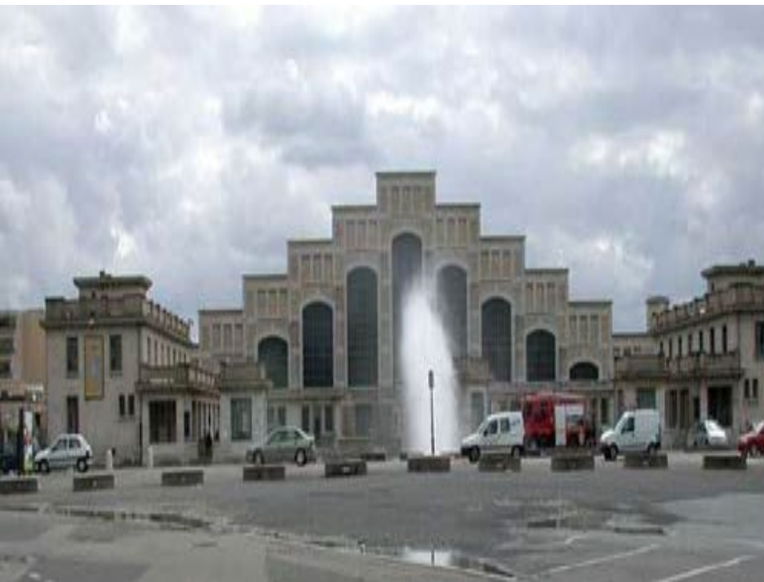
Олимпийский стадион. Лион. Архитектор Тони Гарнье