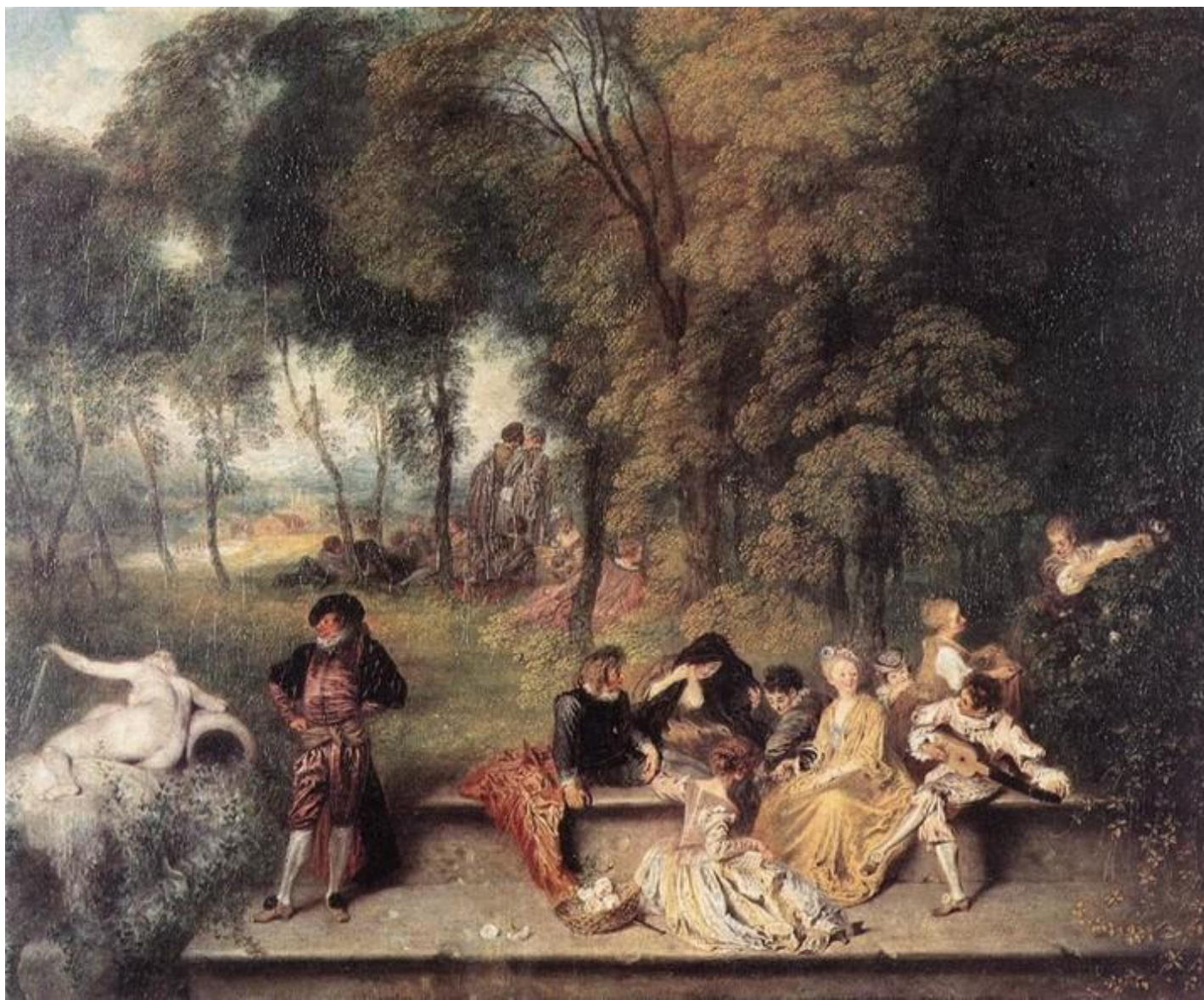
Общество в парке