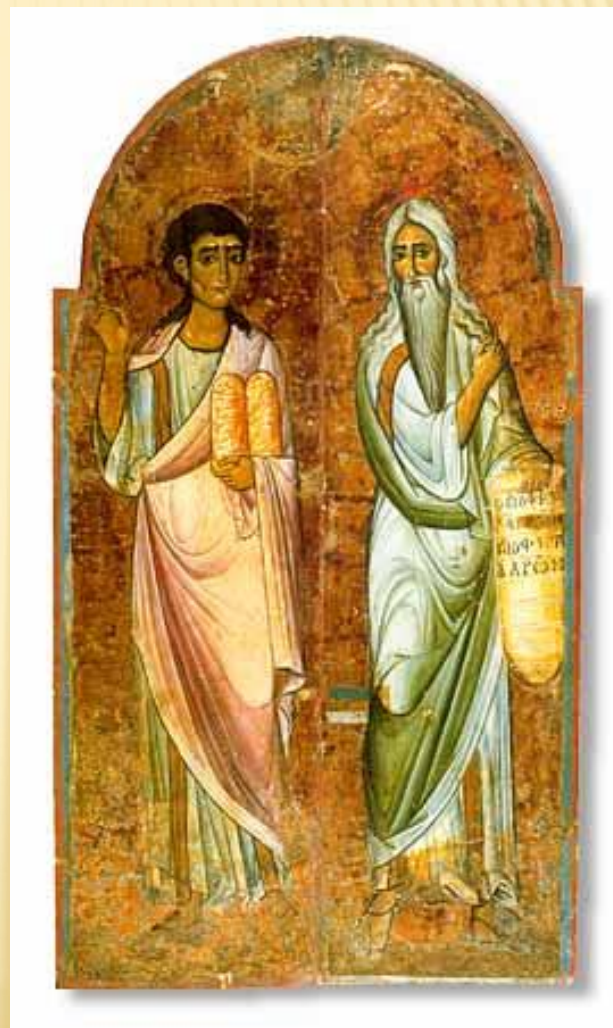
Моисей и Аарон. Царские врата из монастыря св. Екатерины (Синай).

▣ Проро́ки в исламе ( араб. نبي) — это люди, избранные Богом (Аллахом) для передачи откровения ( вахй ).