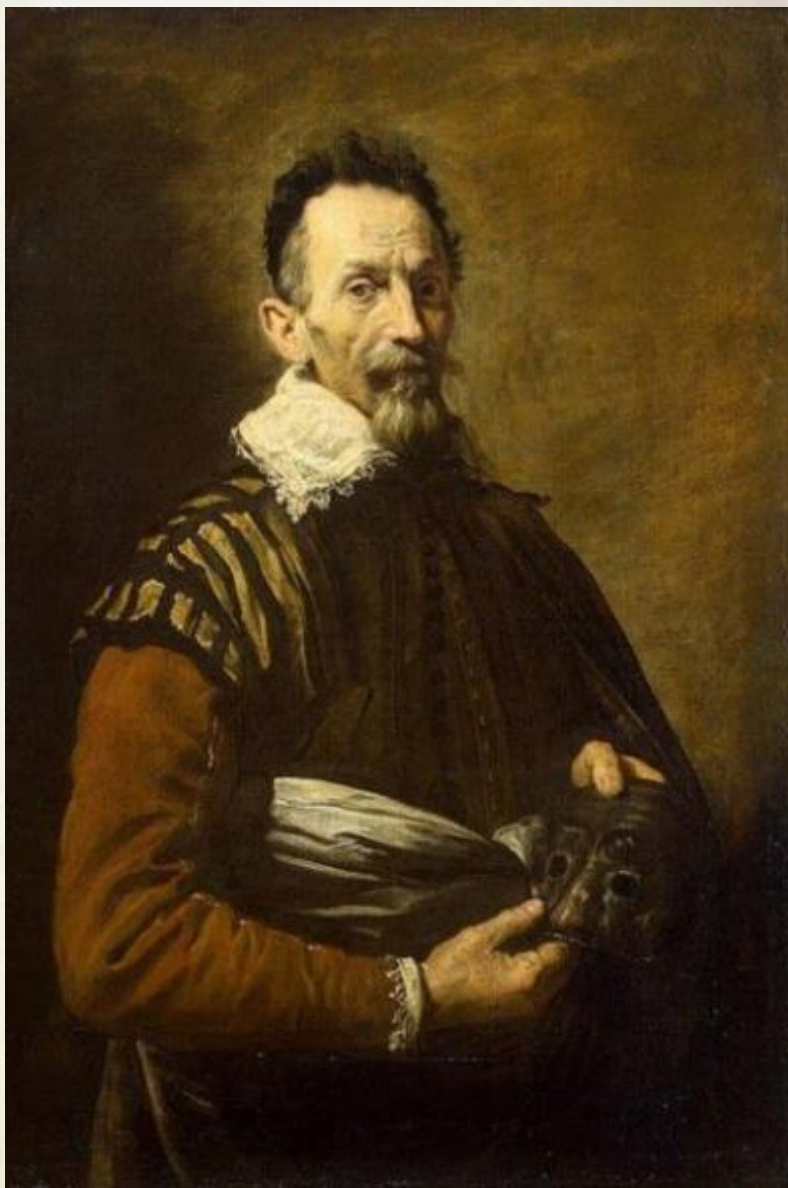
Мигель де Сервантес Сааведра (1547 - 1616)

известен как автор одного из величайших произведений мировой литературы — романа «Дон Кихот».