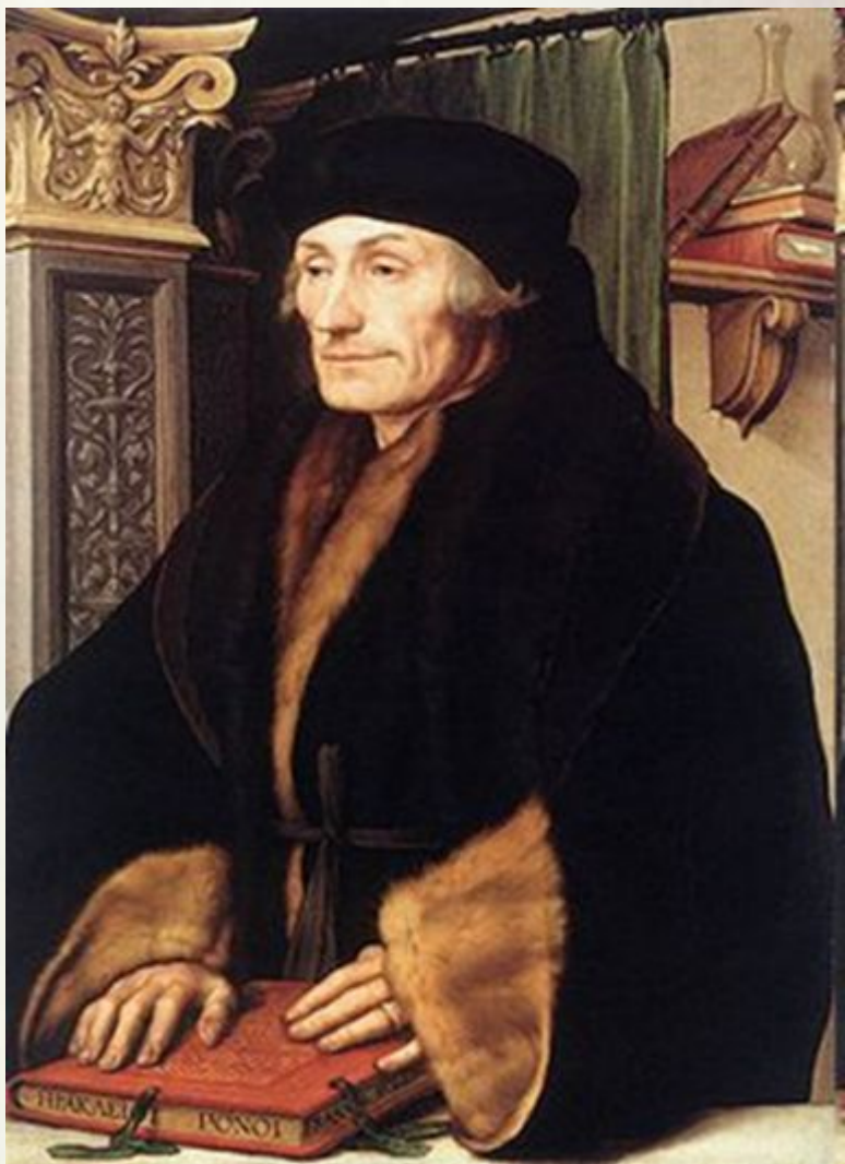
Эразм Роттердамский (1469 - 1536)

С. Цвейг, писатель, биограф гуманиста, назвал гуманиста «славой и светочем своего времени».