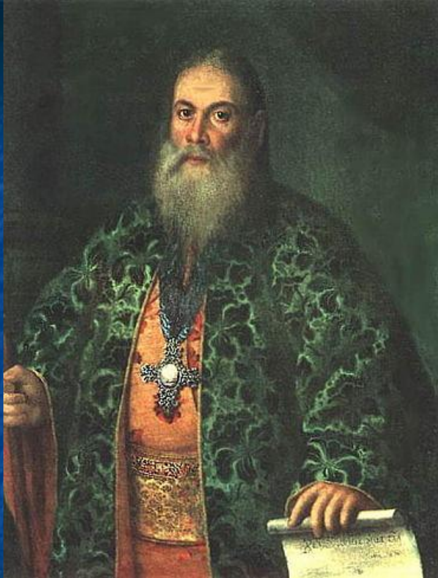
А.П. Антропов, портрет протоиер. Ф. Я Дубянского, духовника Елизаветы, апотом и Екатерины,