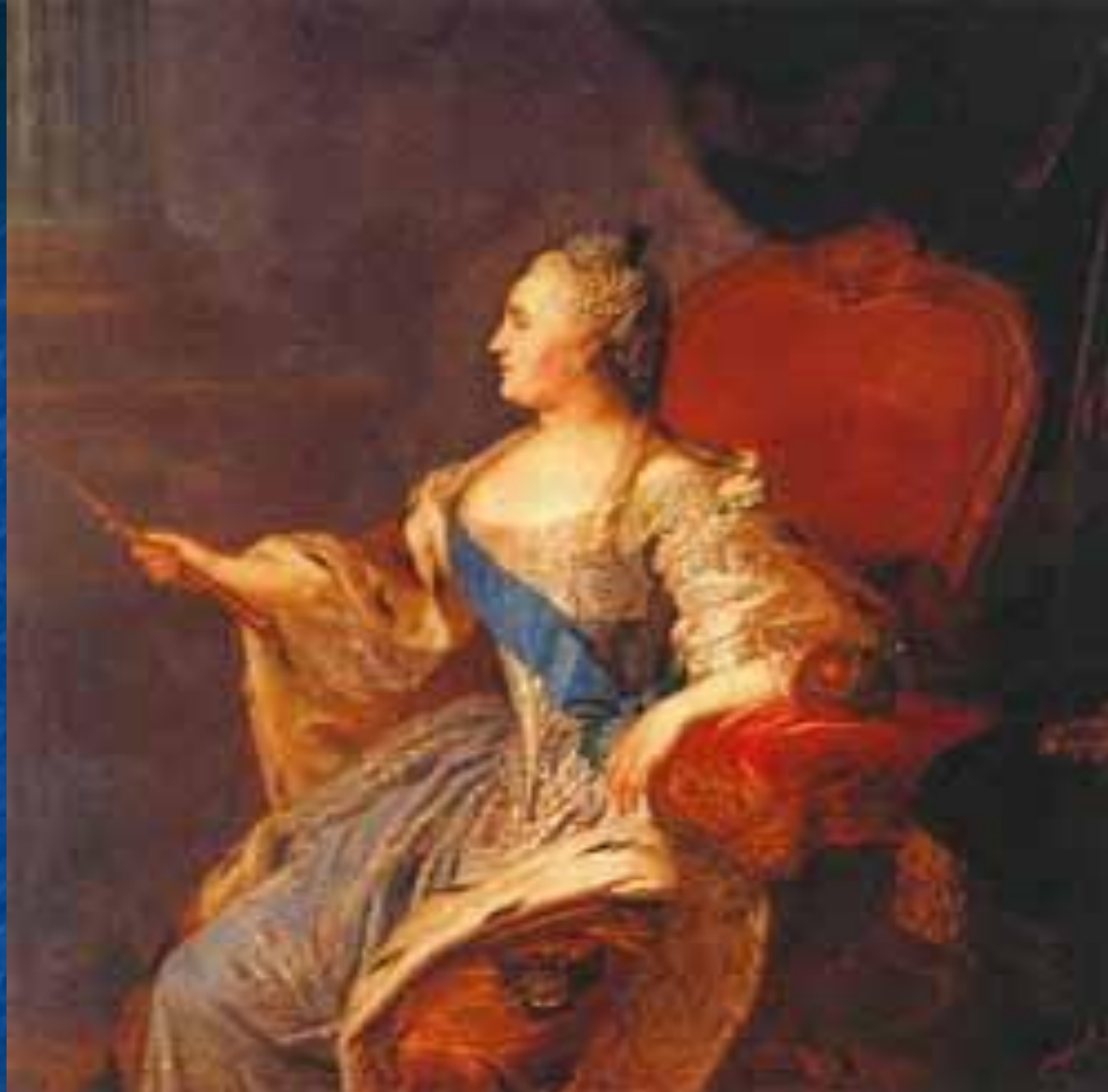
Рокотов. Екатерина II. «писан» в 1763 году, месяц май 20 дня.