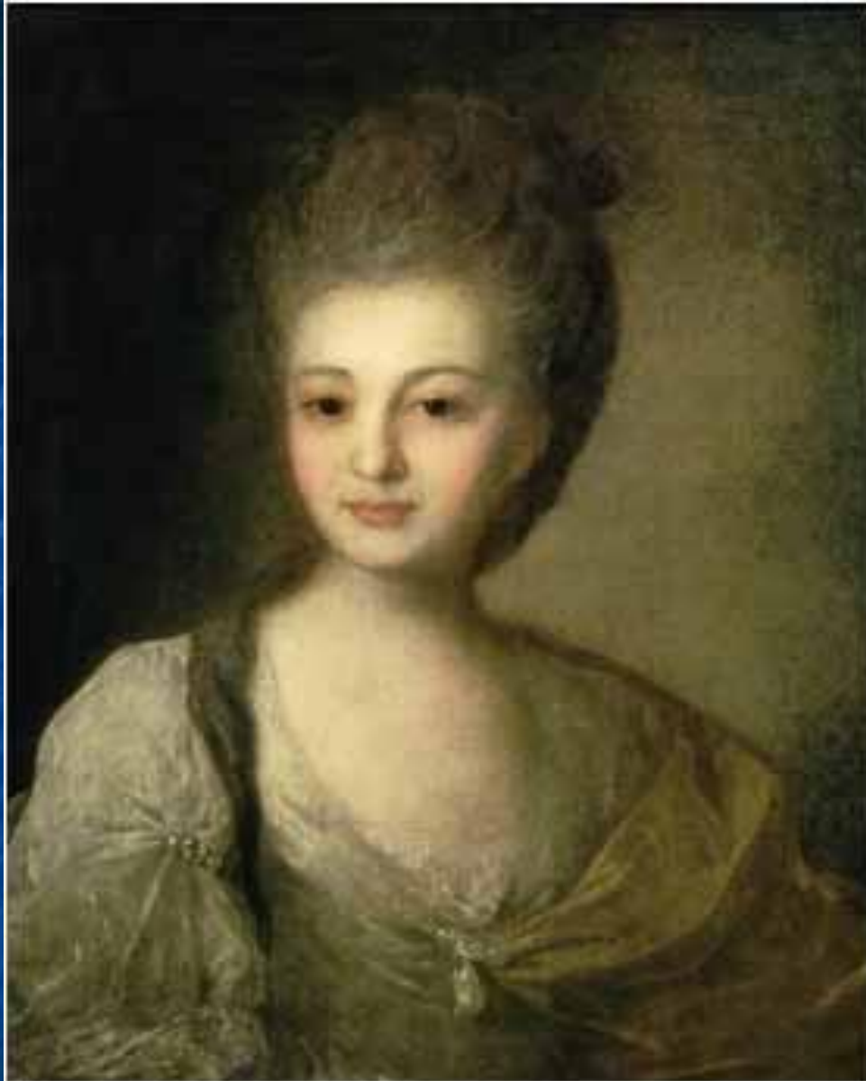
«Портрет А.П.Струйской» (1772).