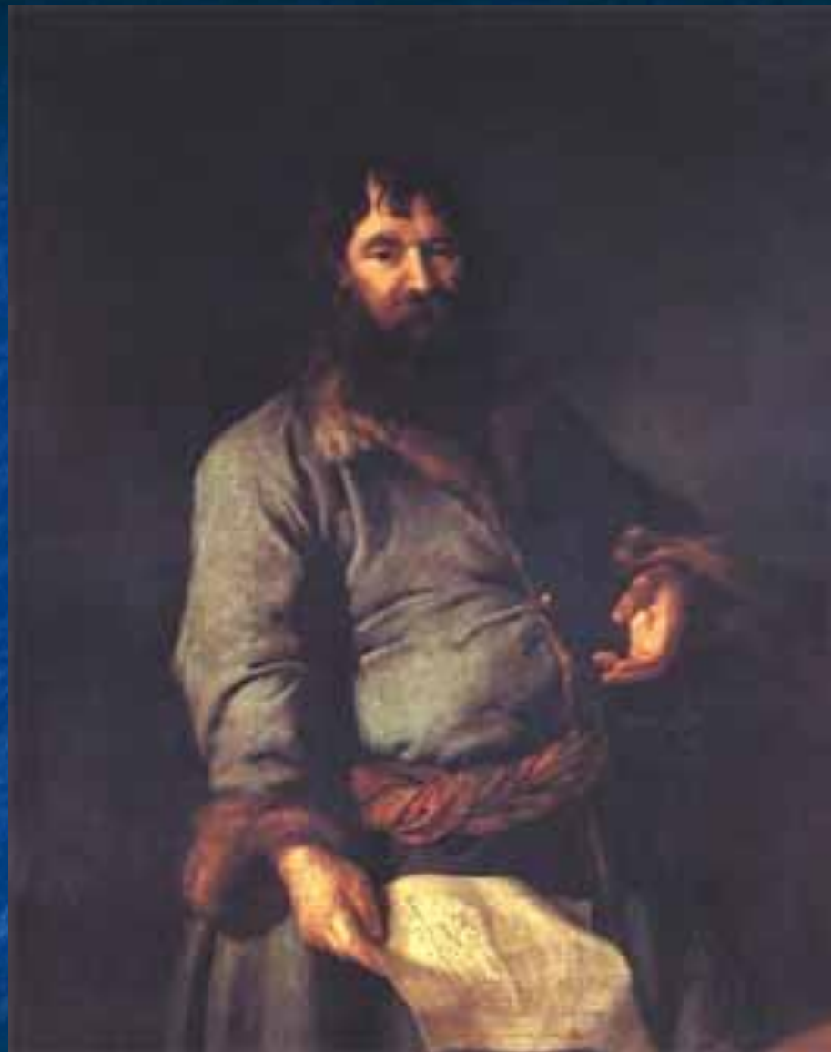
"Портрет Н.А.Сеземова" (1770), Левицкий