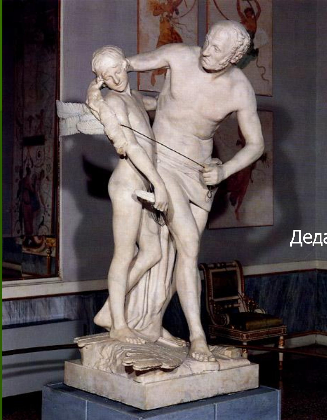
Дедал и Икар