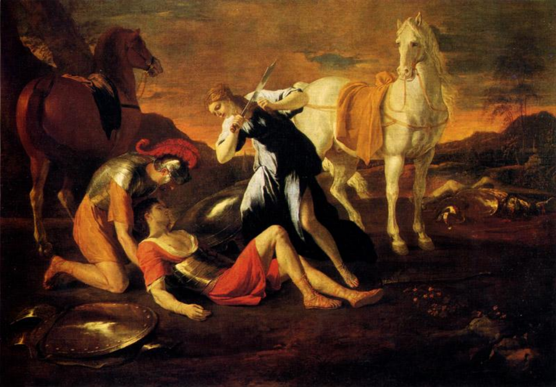
Танкред и Эрминия