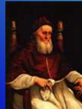
Папа Юлий II делла Ровере'