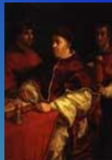
Папа Лев X Медичи(1517-1519)