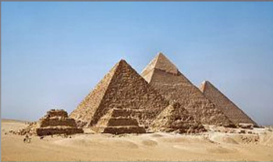
Пирамиды в Гизе

Одной из основных задач при постройке гробниц фараонов являлась задача произвести впечатление подавляющей мощи. Но увеличение надземной части масштаба не давало нужного эффекта. Этот эффект был получен, когда смогли увеличить надземную часть здания в высоту по диагонали. Так возникли знаменитые египетские пирамиды.