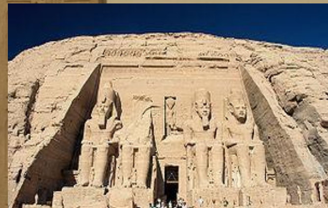
Фасад храма Рамзеса II

может служить храм Рамзеса II в Абу-Симбеле. Ансамбль состоит из двух сооружений: Большого храма и Малого. Большой был посвящён фараону и трём богам: Амону, Ра, и Птаху. Малый воздвигли в честь богини Хатор, образ которой совпадал с образом жены Рамзеса II Нефертари. Существенным нововведением Архитектуры нового царства явилось отделение гробницы от заупокойного храма. Первым фараоном, нарушившим традицию, стал Тутмос I, решивший захоронить свое тело не в пышной гробнице заупокойного храма, а в высеченной, в отдаленном ущелье гробницы, в так называемой «Долине Царей».