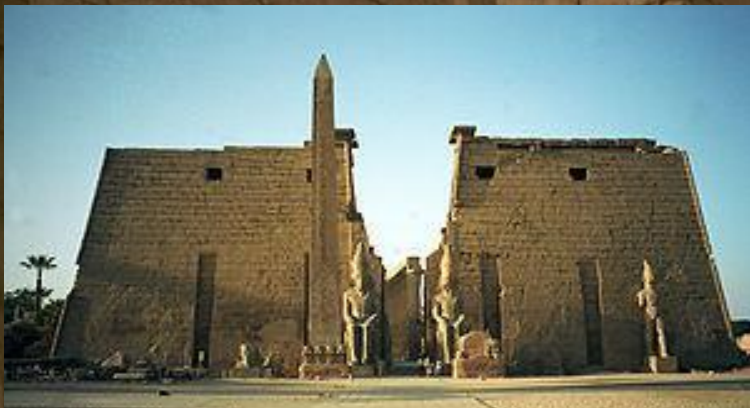
Ворота Луксорского храма

К подобному типу храмов относятся оба храма Амона в Фивах — Карнакский и Луксорский.