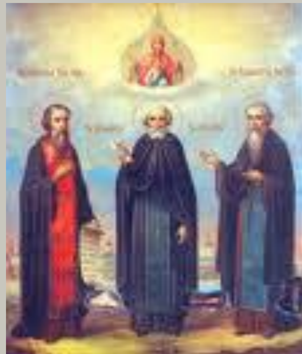
Преподобные Зосима, Савватий, Герман – Соловецкие чудотворцы

19-21 августа 1992 г. мощи преподобных Зосимы, Савватия и Германа, Соловецких чудотворцев, были перенесены из Петербурга в обитель. Торжества возглавлял Патриарх Алексий II; 22 августа (по н. ст.) стало праздноваться как Собор Соловецких святых.