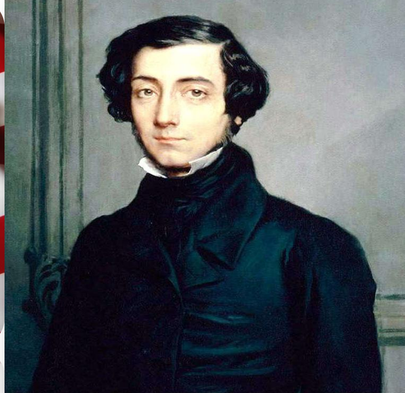
Алексис де Токвиль